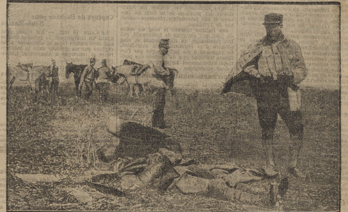
Cadavre d'un officier allemand, observateur à bord d'un avion descendu par un aviateur français