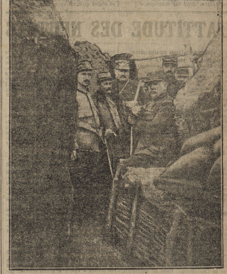
Officiers et sous-officiers d'un régiment du Sud-Ouest dans la tranchée