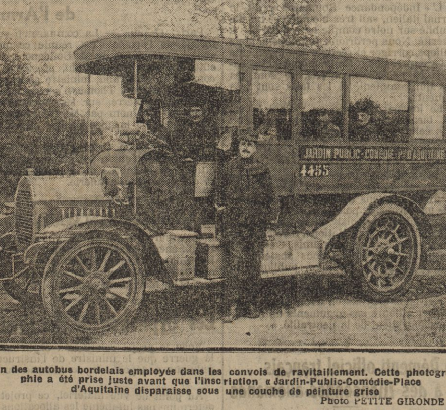
Un des autobus bordelais employés dans les convois de ravitaillement. Cette photographie a été prise juste avant que l'insurrection à Jardin-Public-Comédie-Place d'Aquitaine disparaisse sous une couche de neige grise.

FEUILLETON DE LA « PETITE GIRONDE » DU 18 JUIN 1915