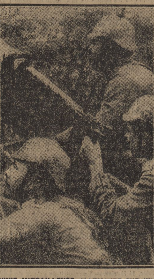
TIR D'UNE MITRAILLEUSE ALLEMANDE SUR UN AVION