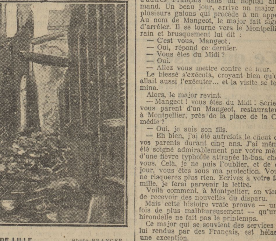
LES RUINES RUE DE LILLE