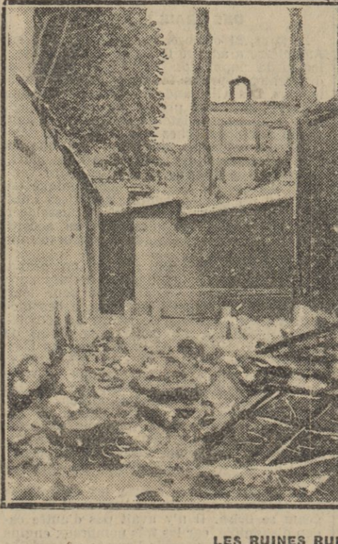
LES RUINES RUE DE LILLE