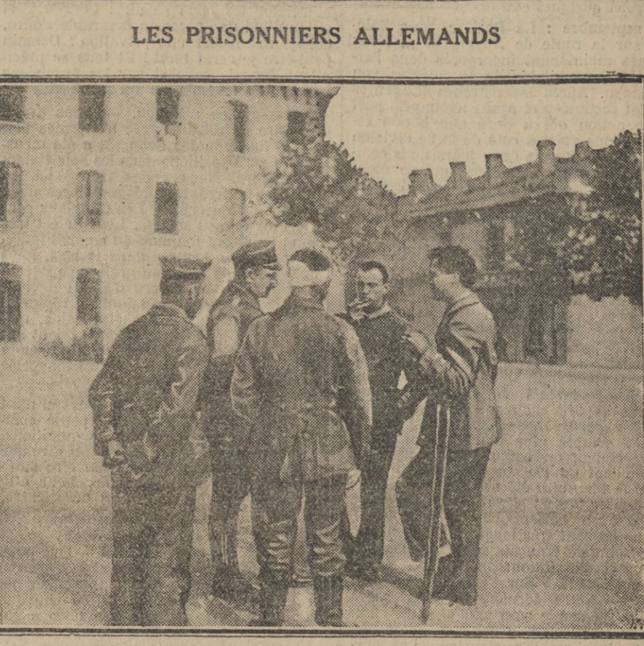
Un groupe d'officiers dans la cour de la caserne Boudet, à Bordeaux.