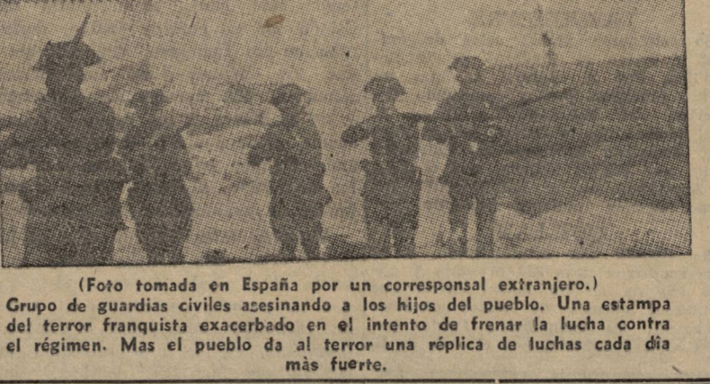
Grupo de guardias civiles aceinando en los hijos del pueblo. Una estampita del terror franquista exacerbado en el intento de frenar la lucha contra el régimen.