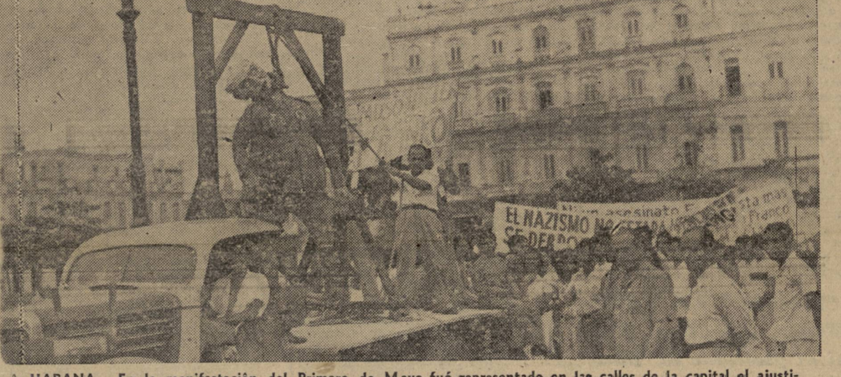
HABANA.—En la manifestación del Primero de Mayo fué representado en las calles de la capital el ajusticiamiento del asesino Franco.