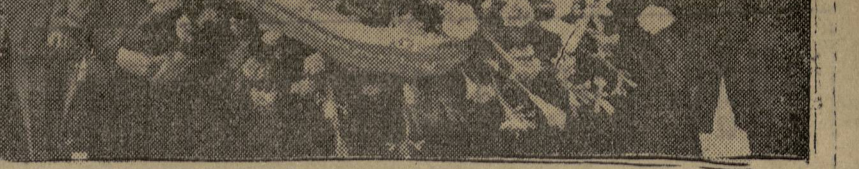
Compañeros ugetistas acuden con ramos de Flores al mitin de clausura del II Congreso de la Junta Central de la U. G. T.

La sesión de la mañana del día 11 fué dedicada a intervenciones de los delegados, y la de la tarde al estudio de las ponencias elaboradas por las Comisiones, que fueron todas aprobadas por unanimidad.