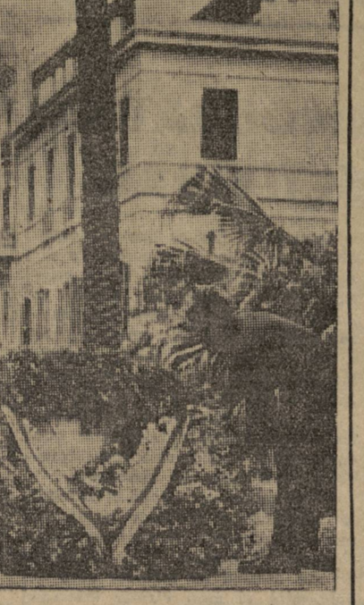
EN TUNEZ.—Tras la manifestación del 14 de Abril los republicanos españoles depositan una corona en la tumba del Soldado Desconocido.

En la semana transcurrida, nuevas detenciones en España se acumulan al balance sangriento del terror franquista.