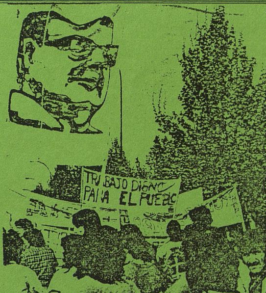
CHILE: Manifestación.