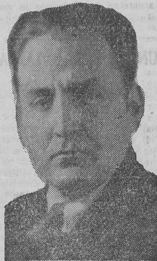
VÍCTOR RAUL HAYA DE LA TORRE

En el mismo número se describe el curioso accidente sufrido por el