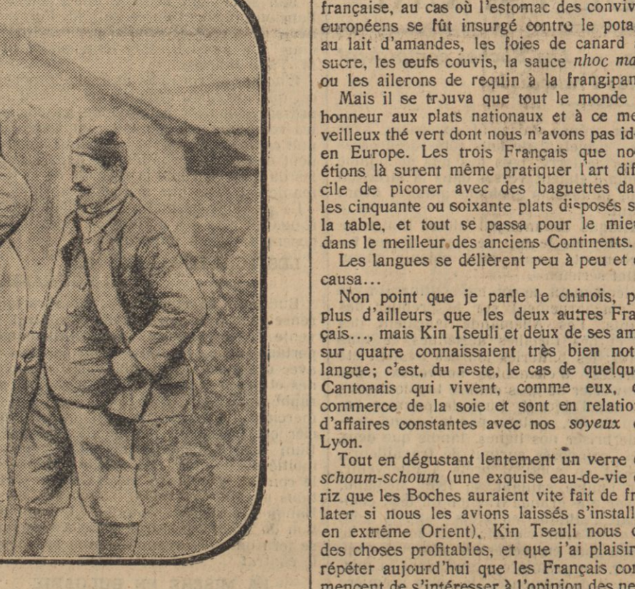
LE « GUSTOT » REEMPLIT LES MARMITES DES POILUS