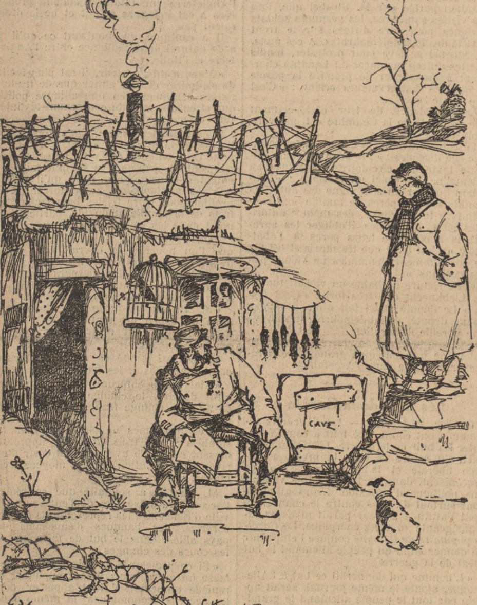
Des fils barbelés sur la cagnia! T'es donc pour des Boches? Non, mais c'est rapport aux copains qui voudraient me barboter ma cheminée!