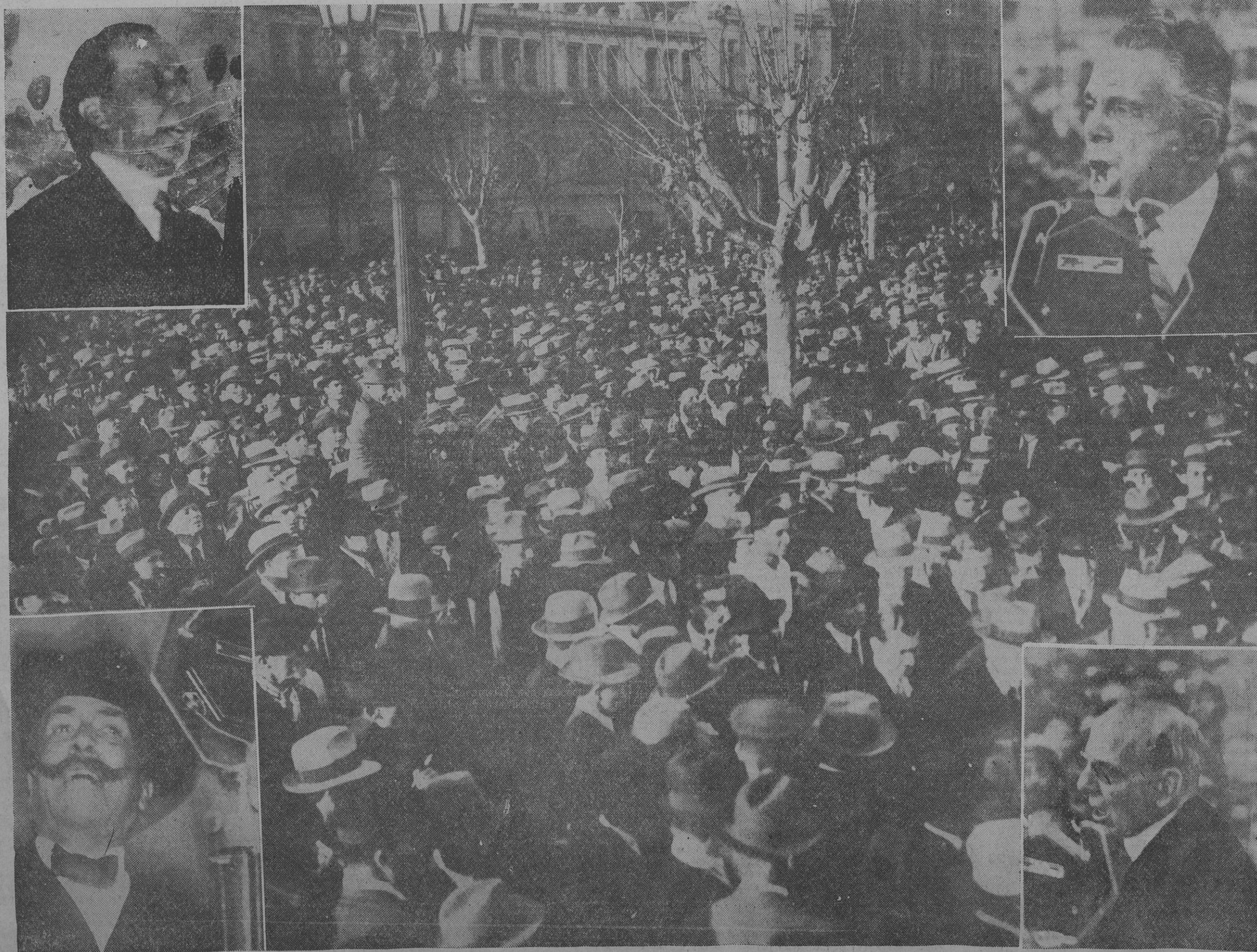
Vista panorámica de uno de los sectores de público. En los círculos: Diputados Miguel B. Navello y Nicolás Repetto, y senadores Mario Bravo y Alfredo L. Palacios.

Ha llegado la hora de demostrar al país dónde está el verdadero patriotismo.