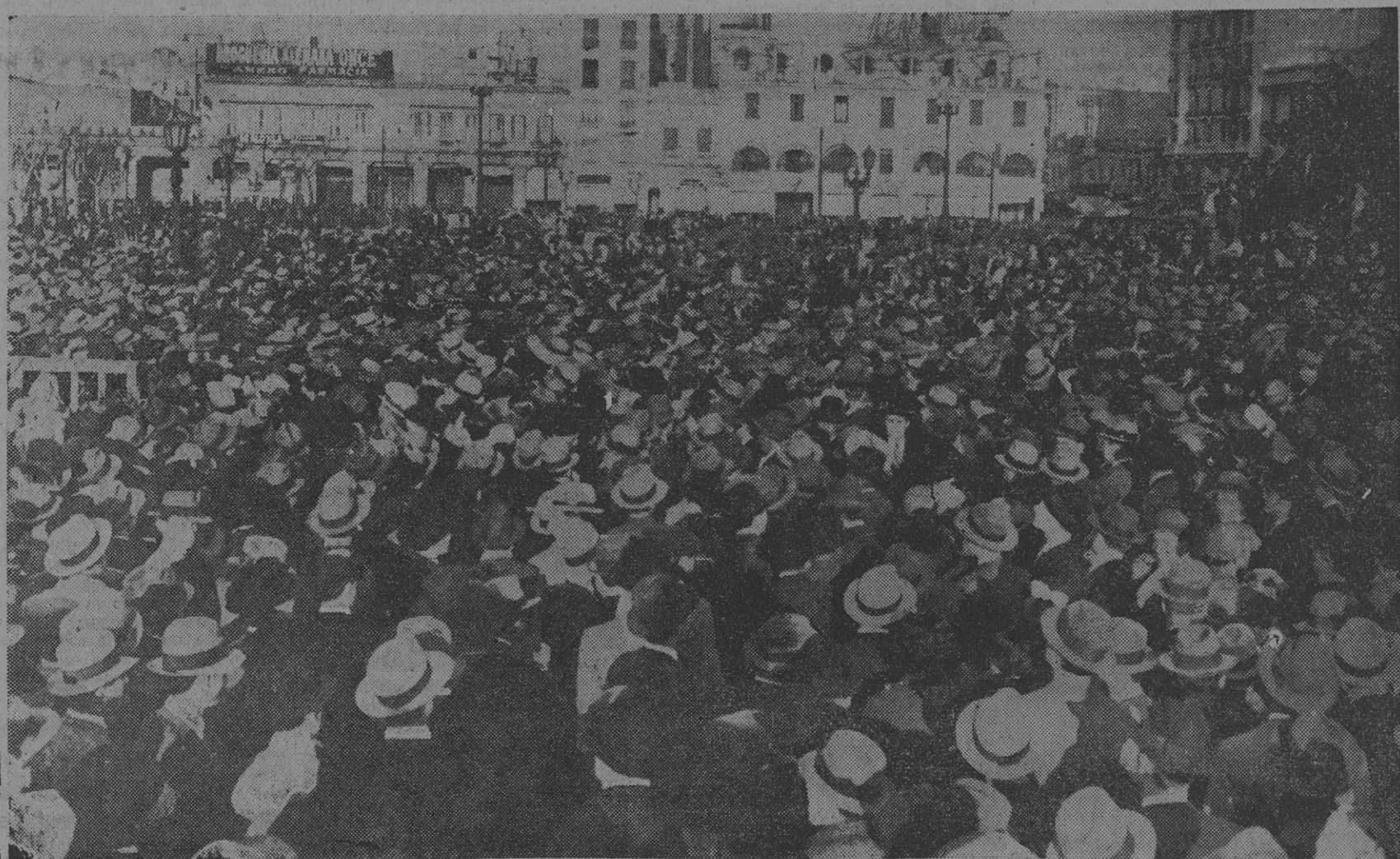
Un aspecto de la enorme multitud, que testimonia la grandiosidad de la asamblea democrática de ayer

inspirada en el santo derecho a la vida y en el sagrado principio de la justicia.