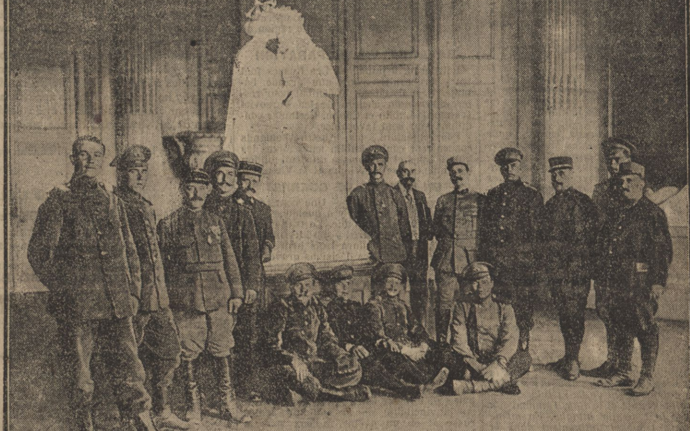
Soldats russes faits prisonniers par les Allemands et transportés sur le front occidental pour y effectuer des travaux de terrassement.