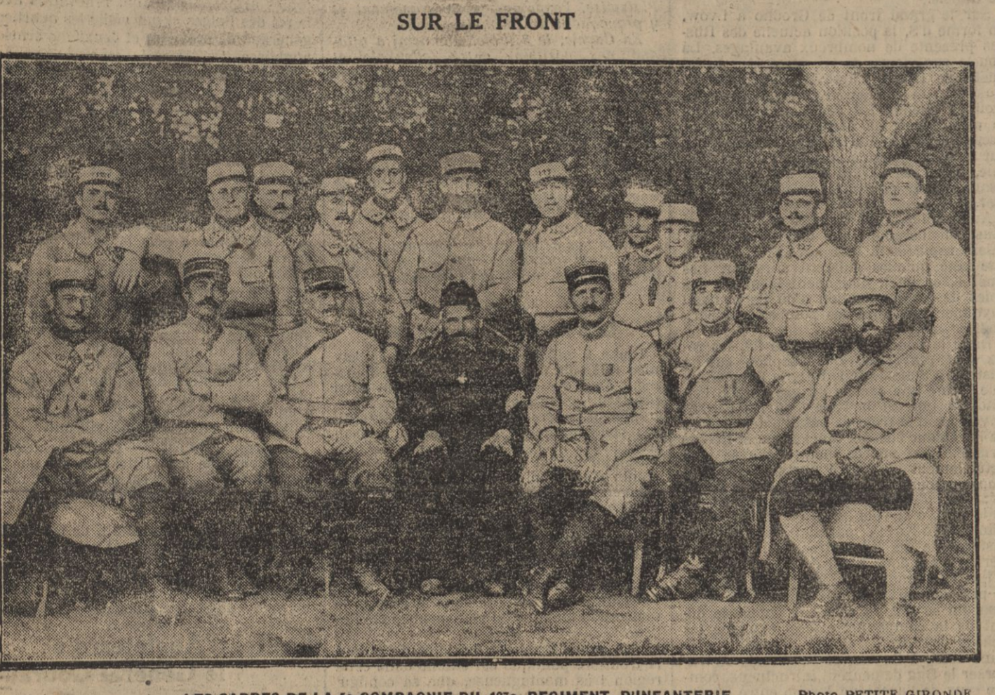
LES CADRES DE LA 56 COMPAGNIE DU 172 e RÉGIMENT D'INFANTERIE