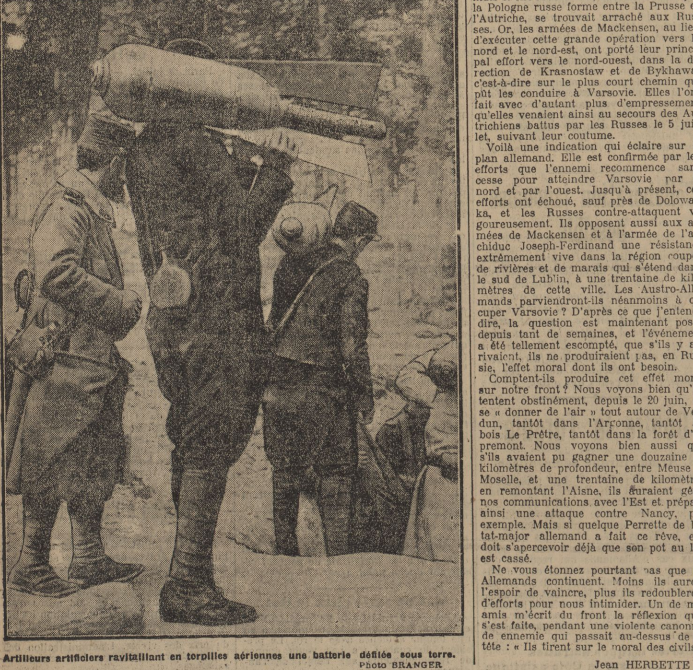
Artilleurs artilleurs ravitaillant en torpilles aériennes une batterie défilée sous terre.

Il était parmi eux ne le savaient pas encore. Dans les villes qui le traversent aussi, peu de monde le reconnaît. On le prend pour un simple officier général.