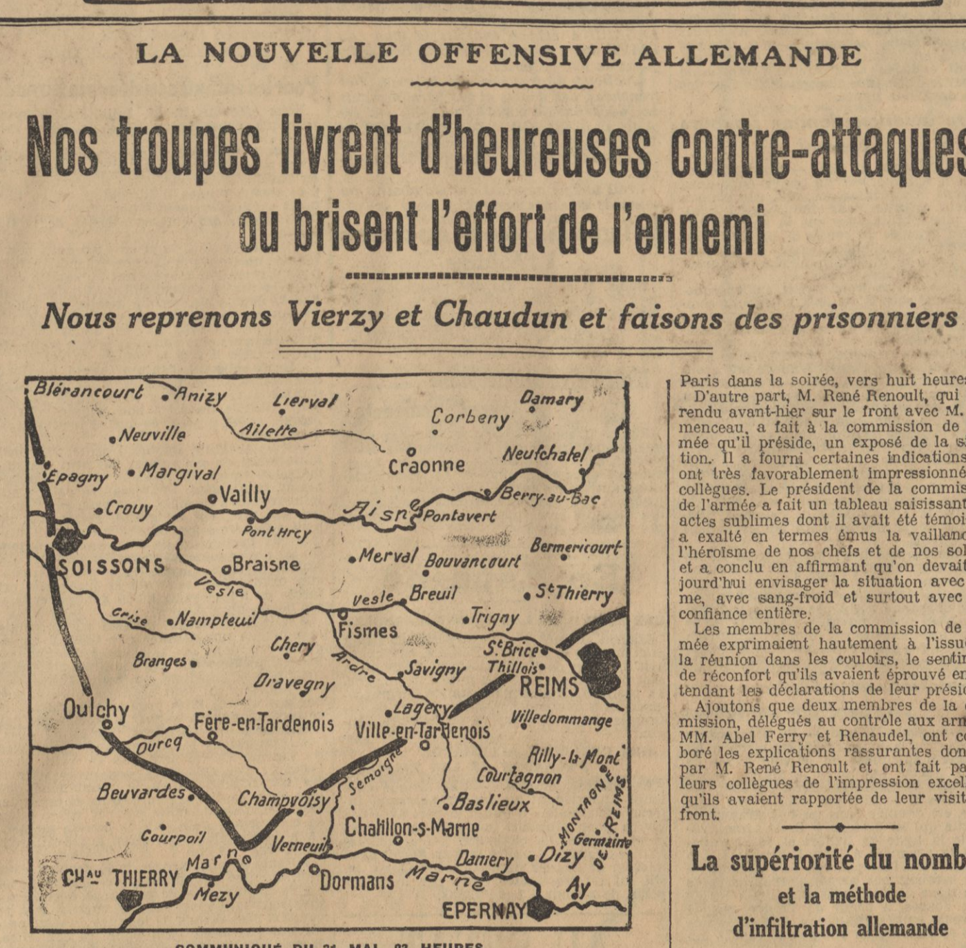
COMMUNIQUE DU 31 MAI, 23 HEURES

LEUR ENTIERE LIBERTE D'ACTION Pour des raisons diverses, d'ailleurs maintenant connues, appréciables et qui ont déjà motivé des sanctions sévères, il est permis de penser qu'il ne faut pas pousser à la manière la plus brutale sur des lignes qu'il n'a du reste pas pu rompre.