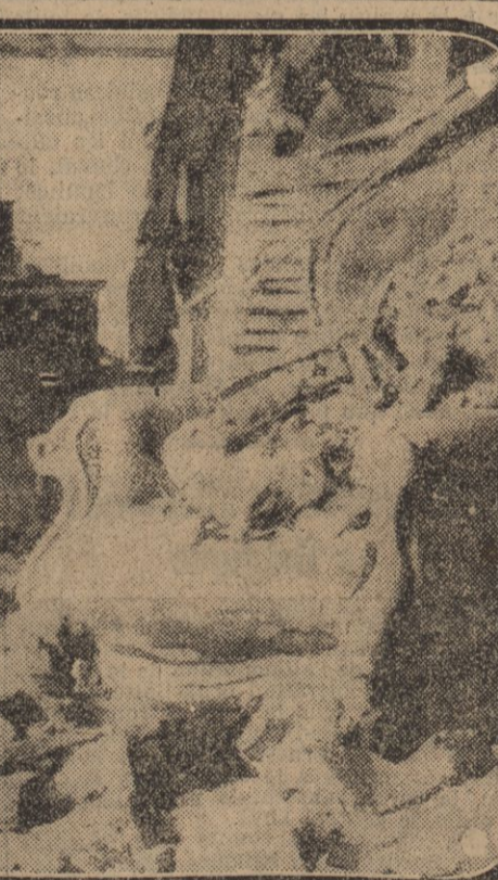
APRES LE BOMBARDEMENT DE LA OOTE ANGLAISE : LES EFFETS D'UN OBUS

de gêne que nous traversons, former entre eux un Syndicat de garantie qui assurerait à tous le concours éventuel du Crédit agricole.