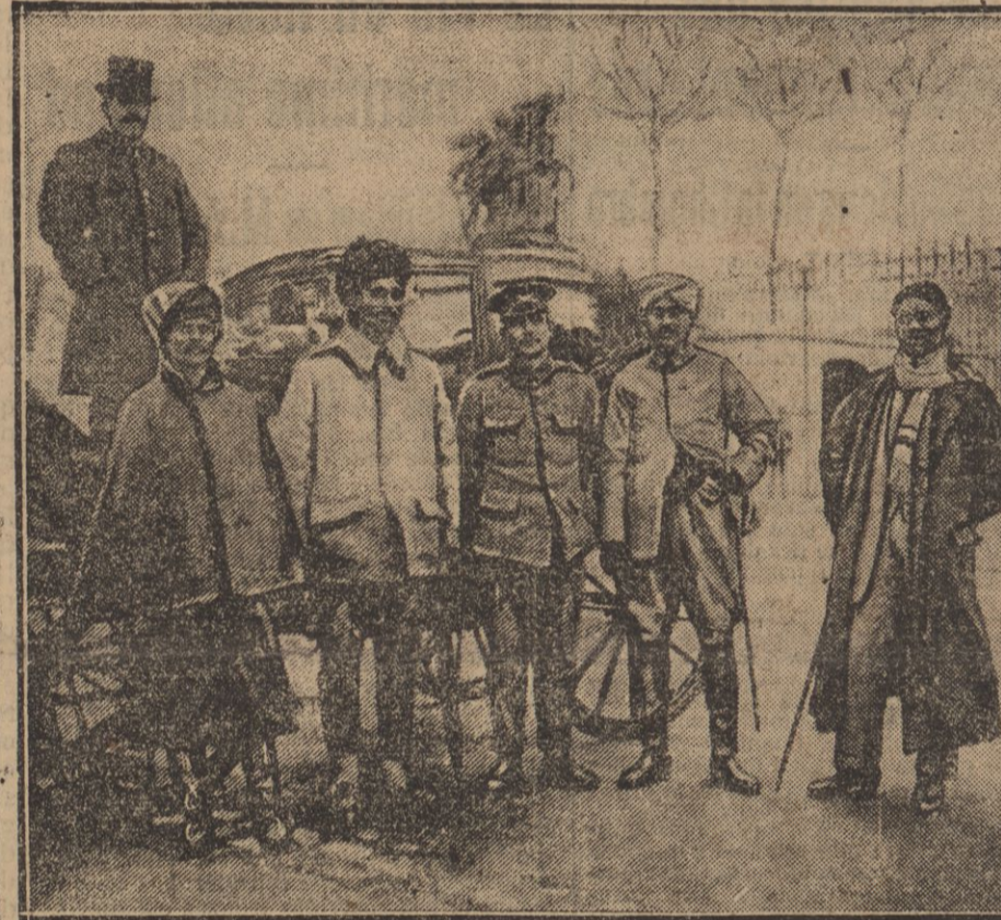
OFFICIER ANGLAIS ET SOLDATS HINDOUS DE PASSAGE A PARIS. L'UN D'EUX A DROITE A ETE BLESSE DANS LES COMBATS DES FLANDRES.

cadu du Soudan, paraît encore moins se soucier d'apporter son concours aux Turcs et aux Allemands, si l'on en juge par ces déclarations.