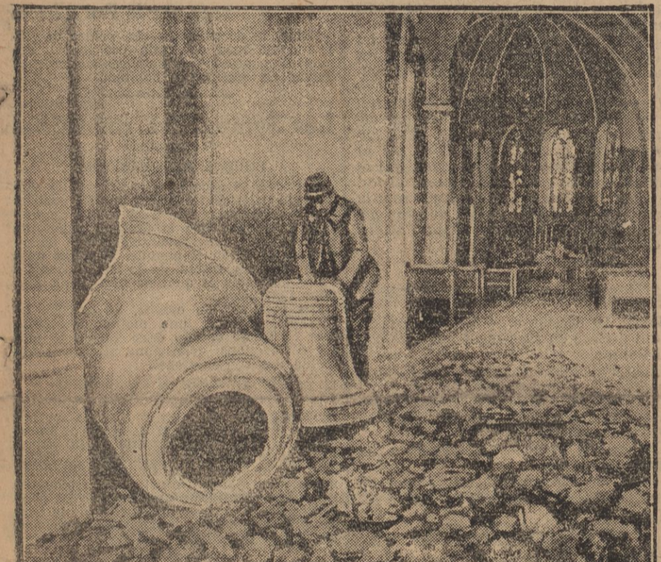
LES CLOCHES DE L'EGLISE SONT TOMBEES PARI LES DECOMBRES

nients ou des impossibilités qui ne permettent pas d'en attendre une solution pratique.