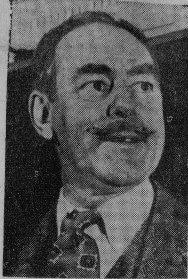
Mr. ACHESON Ministro de Negocios Extranjeros de Norteamérica