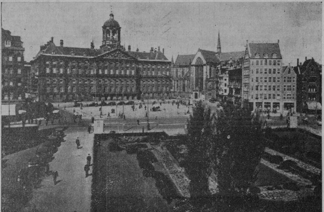
AMSTERDAM. Escenario, en otros días, de trascendentales Congresos socialistas y sindicales