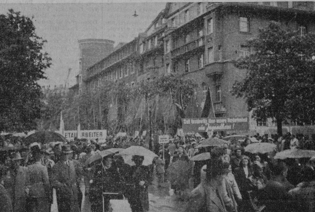
Cabeza de la manifestación con las airosas banderas rojas de las Juventudes Socialistas y de los metalúrgicos. Al fondo, a la derecha, la Casa del Pueblo de Zurich