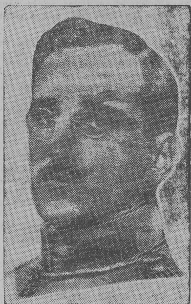
de Yugoslavia, muerto ayer en Marsella, víctima de un atentado.