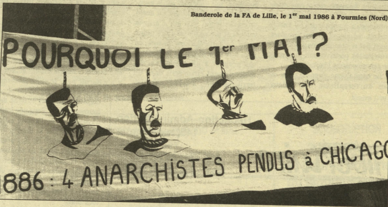
Banderoles de la FA de Lille, le 1 er mai 1986 à Fourmies (Nord).

PARIS - 30 AVRIL Réunion publique de la FA