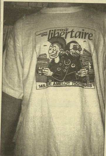
Impression sur le devant