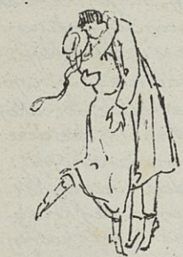
... waar dome van hem hand nijaand.

En dan, zijn de vrouwen niet, zoo als wij, kunne murmen, je maken? Dat alles zegt de schrijver ons, en bewijst het met bijna al de onom-