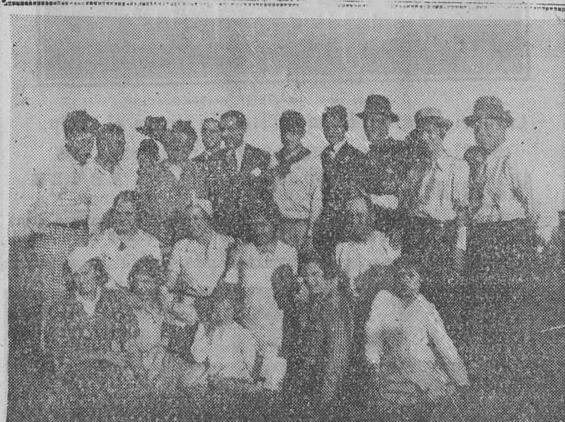
EL CUADRO ARTISTICO DE LA AGRUPACION "DOMINGO F. Sarmiento", que intervino en un festival realizado en pleno campo.