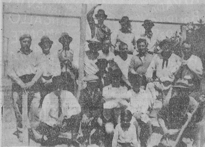
GRUPO DE ASOCIADOS A LA AGRUPACION ARTISTICA, dedicados a la tarea de construir el escenario y galpón para la representación teatral.

BARADERO, 17. — Como estaba anunciado, se realizó el domingo 11 del corriente, la velada y conferencia a beneficio de la Casa del Pueblo, en el lugar denominado "La Paloma", situado a 7 leguas de la planta urbana y en pleno campo. Pese a la noche tormentosa, no menos de trescientas personas, en su totalidad familias de agricultores, asistieron a este acto.