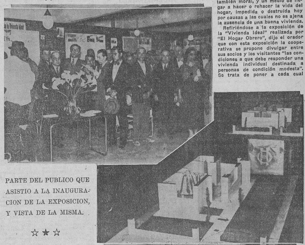
PARTE DEL PUBLICO QUE ASISTIO A LA INAUGURACION DE LA EXPOSICION, Y VISTA DE LA MISMA.

Refiriéndose a la exposición de la "Vivienda Ideal" realizada por "El Hogar Obrero", dijo el orador que con esta exposición la cooperativa se propone divulgar entre sus socios y los visitantes "las condiciones a que debe responder una vivienda individual destinada a personas de condición modesta". Se trata de poner a cada cual