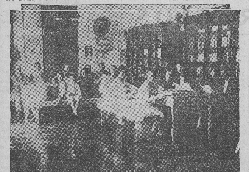
SALA DE LECTURA DE LA BIBLIOTECA "ALMAFUERTE", ANEXA AL Centro Socialista de Trenque Lauquen.

El periódico Como complemento de toda la labor socialista local y para su mejor difusión entre el pueblo, el Centro Socialista edita un periódico ti-