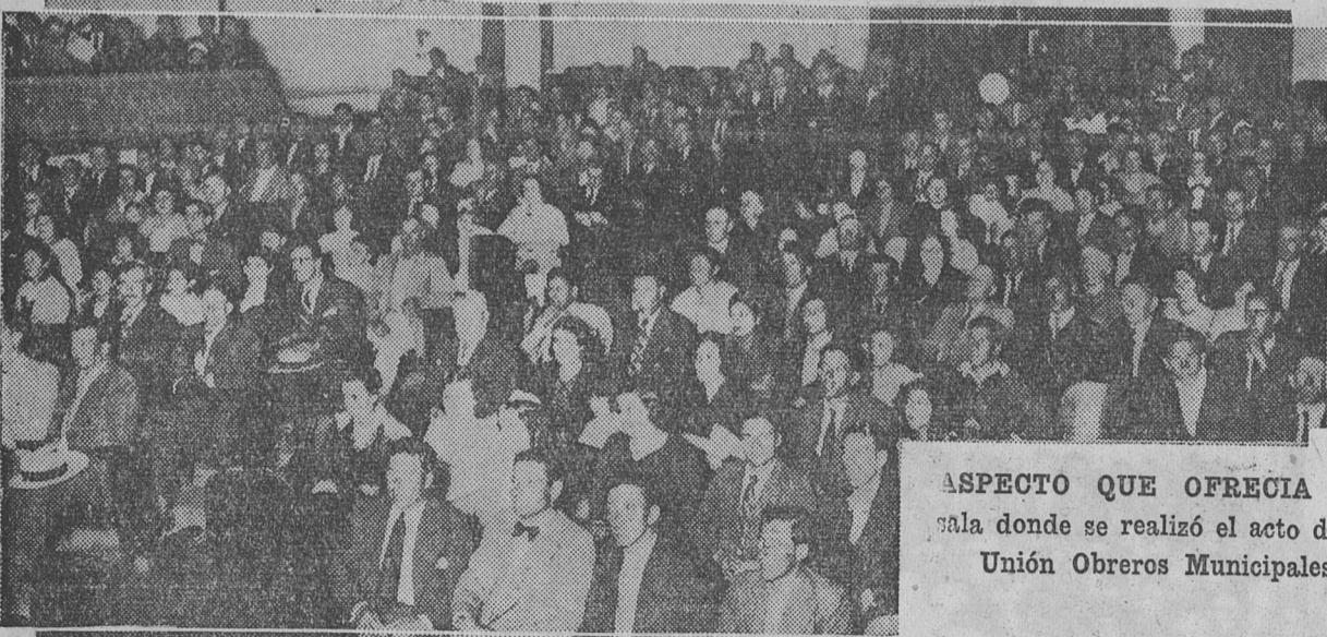
ASPECTO QUE OFRECÍA LA sala donde se realizó el acto de la Unión Obreros Municipales

En dicho acto, que dará comienzo a las 21 horas, además de pasar varias películas cinematográficas, hablarán los candidatos a directores de la Caja Municipal de Previsión Social.