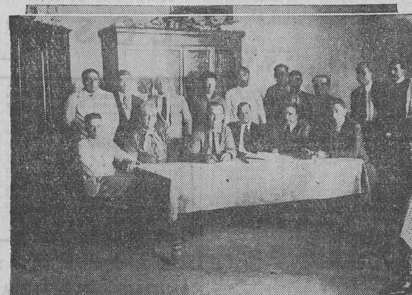
COMISIONES DIRECTIVA Y DE BIBLIOTECA DE LA FRATERNIDAD y Unión Ferroviaria, seccional de Trenque Lauquen

Movimiento gremial Todo el personal de máquinas de esta importantísima zona ferroviaria está afiliado a esta seccional de "La Fraternidad", que a más de atender los asuntos gremiales realiza una importante labor cultural y de perfeccionamiento técnico; conjuntamente con los afiliados de la Unión Ferro-