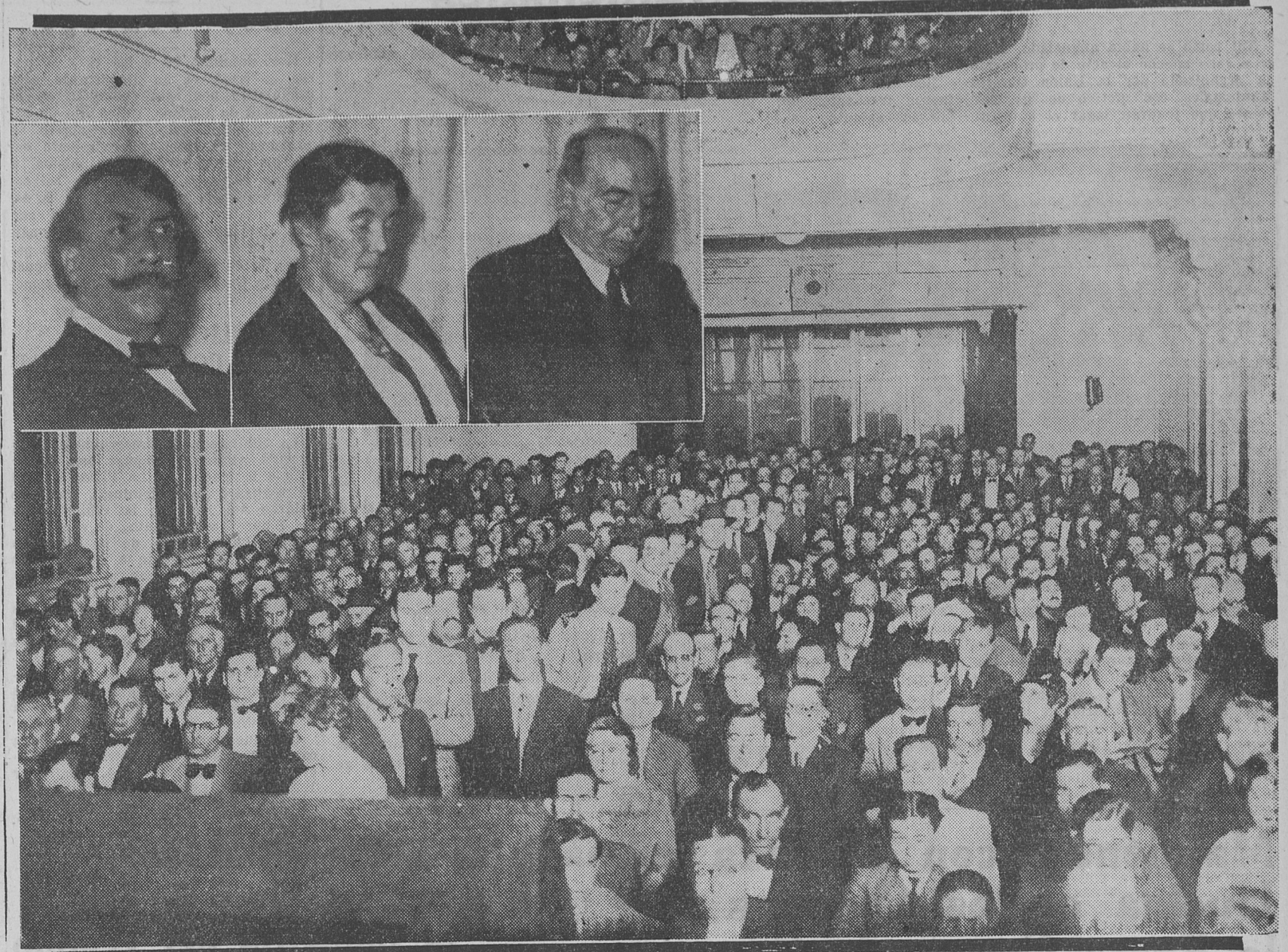
PUBLICO QUE ASISTIO AL ACTO REALIZADO ANOCHE, EN LA CASA DEL PUEBLO, CONTRA LA REACCION ESPAÑOLA, del que publicamos una amplia crónica en la página doce. — Arriba: Los oradores de la magnífica asamblea popular.