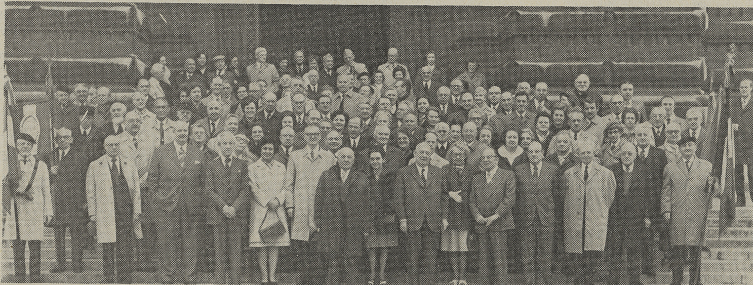
Les congressistes après la réception à l'hôtel de ville.

De nombreux A.C.P.G. se sont retrouvés, dimanche, à Roubaix, à l'occasion du rassemblement des Amicales de camps du Nord. Cette journée de retrouvailles, qui permit d'évoquer bien des souvenirs de la captivité, fut suivie par environ trois cent cinquante congressistes et marquée par plusieurs manifestations.