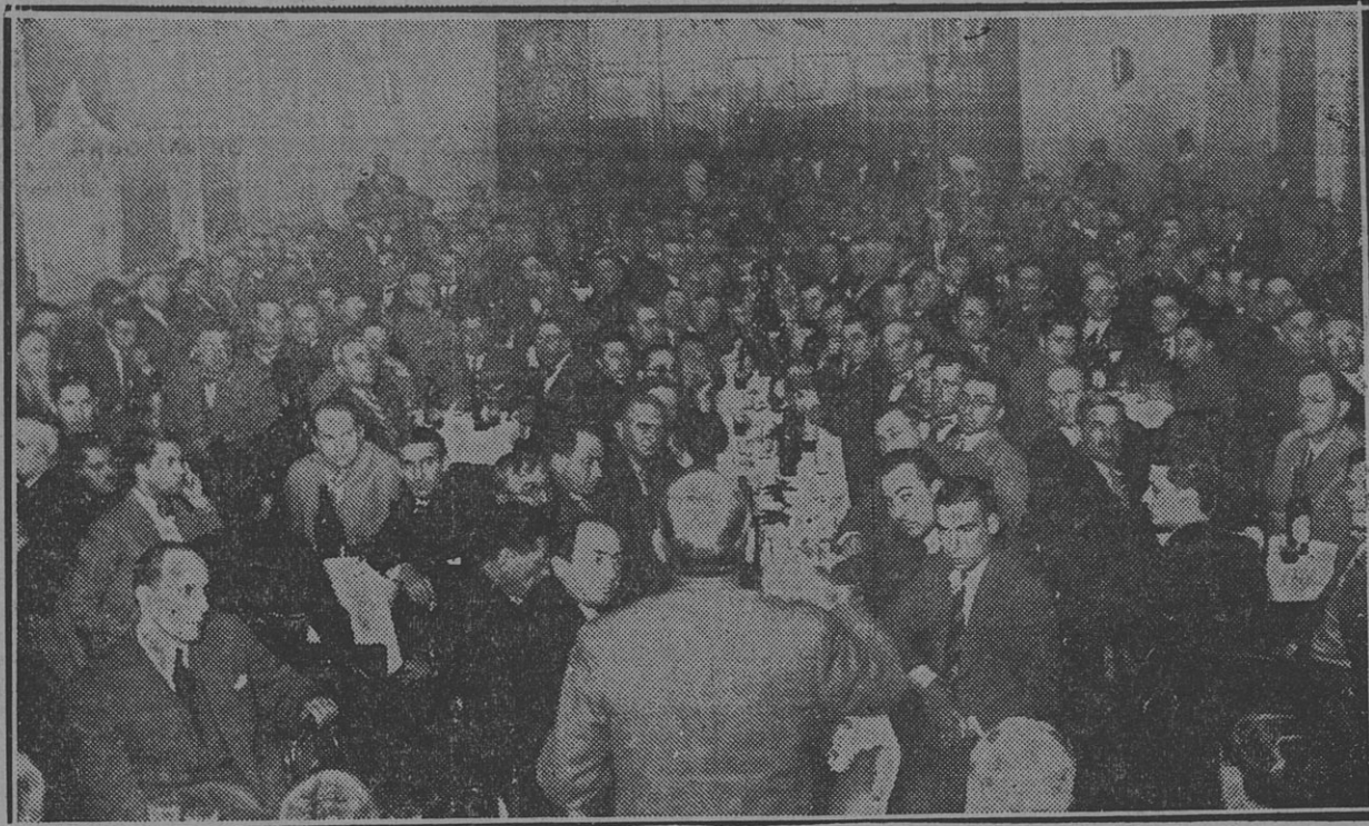
UNA VISTA DEL PUBLICO QUE CONCURRIO AL LUNCH DE CAMARADERIA REALIZADO EN EL SALÓN DE LA CASA DEL PUEBLO CON MOTIVO DE LA INAUGURACIÓN DE NUESTRA NUEVA ROTATIVA