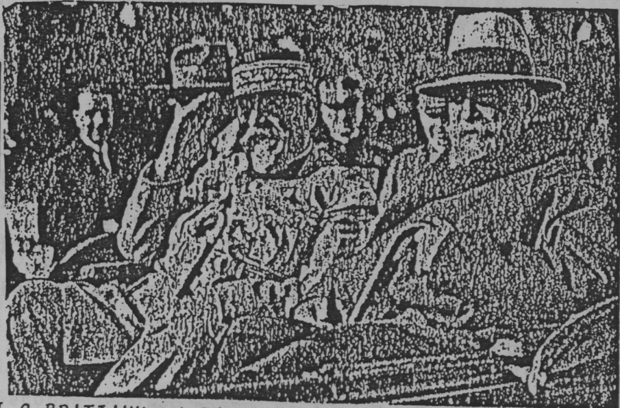
I.C. BRATIANU et Gén. BERTHELOT (Roumanie 1916-18) 11 NOVEMBRE 1918 - 8 MAI 1945

ANCIEN DES FORCES SPÉCIALES ALLIÉES (1940-45) CONSEILLER. GRAND QUARTIER GÉNÉRAL - FORCES DU PROCHE-ORIENT SECRÉTAIRE GÉNÉRAL DE LA FÉDÉRATION DES COMBATTANTS ALLIÉS EN EUROPE ÉDITEUR DU PÉRIODIQUE "EUPOPA" SOCIÉTAIRE DE L'ASSOCIATION DES ÉCRIVAINS COMBATTANTS