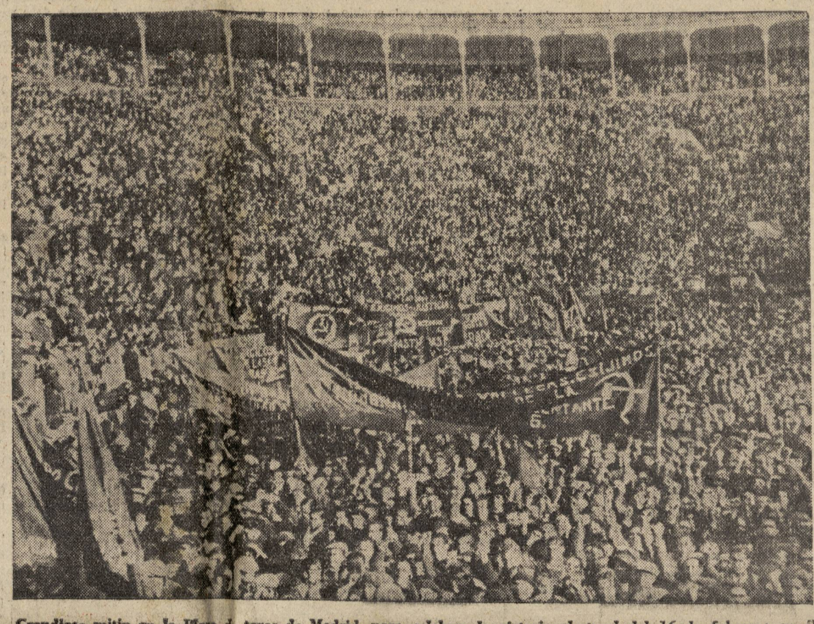
Grandioso mitin en la Plaza de toros de Madrid, para celebrar la victoria electoral del 16 de febrero; en él habló la camarilla Dolores Ibarruri. (Véase en la pág. 3, el artículo titulado: «Un mandato del pueblo español.»)

A mediados de enero, un grupo de 30 guerrilleros de la Agrupación de Levante detuvo en la Sierra, a 40 kilómetros de Teruel, un autobús de viajeros, en el que viajaban algunos falangistas destacados. Los guerrilleros hicieron descender del autobús a todos los viajeros y separaron a seis que ellos conocían como falangistas notorios y que habían tomado una parte activa en la persecución contra patriotas españoles. Después de verificar las informaciones que ellos tenían sobre la intervención de los falangistas detenidos en la bárbara represión desatada en aquella zona, los guerrilleros les condenaron a muerte y los ejecutaron en el acto. Explicaron a los demás viajeros la decisión de los combatientes republicanos de luchar hasta la reconquista de la democracia y de la libertad para España. Y les dijeron que las salvajes medidas puestas en práctica por Pizarro no conseguirán sino avivar el odio que contra el régimen siente la población levantina. El jefe del destacamento añadió que, por su parte, los guerrilleros están dispuestos a contestar como se debe a tales medidas. Después de lo cual, los viajeros no falangistas fueron puestos en libertad y pudieron continuar el viaje.