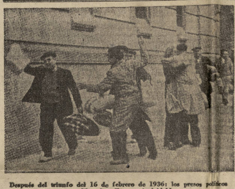
Después del triunfo del 16 de febrero de 1936: los presos políticos son liberados. Escenas inolvidables

«Por lo que a nuestro país respecta, la lucha por la democracia, no se será una lucha entre republicanos y comunistas, sino entre las fuerzas democráticas y populares, contra todas las fuerzas reaccionarias y antidemocráticas que se unían en un solo bloque corrigiendo su equivocación de 1936, frente a las fuerzas populares.»