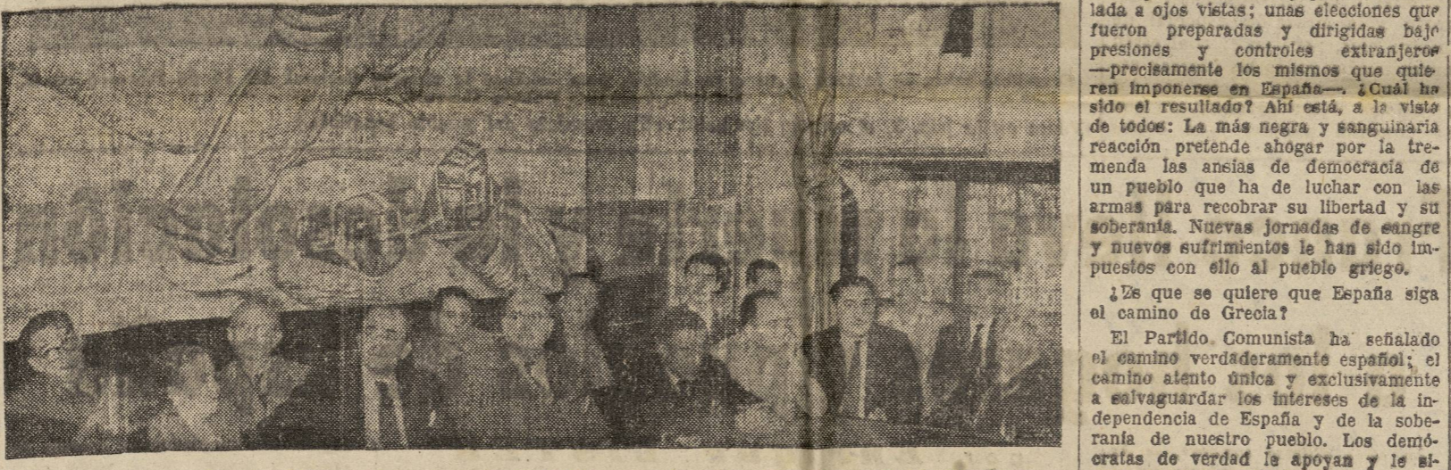
Una vista de la presidencia del acto de clausura de la IV Reunión de ayuda al pueblo español en La Habana.

Para expresar la solidaridad de los metalúrgicos ugetistas con los camaradas que luchan bravamente en España, el Grupo Profesional de metalúrgicos (U.G.T.) celebrará una Asamblea general, el domingo 15 de febrero, en: 91, rue Pierre Baudouin a las nueve y media en punto de la mañana.