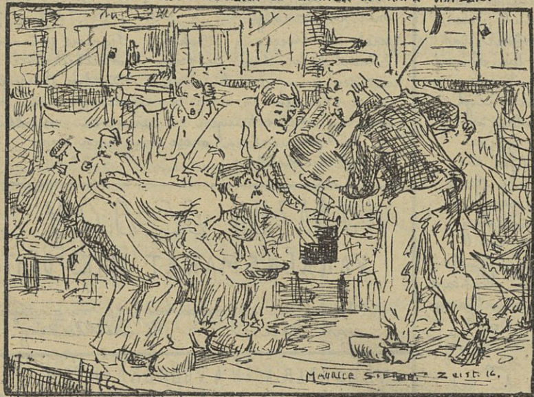
4° LES GROSSES RATIONS - DE FLINKE PORTE