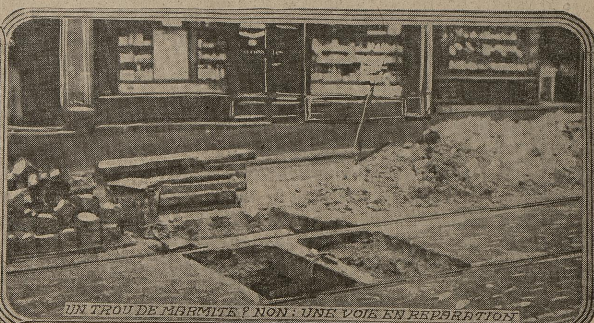
UN TROU DE MARMITE ? NON : UNE VOIE EN REPARATION