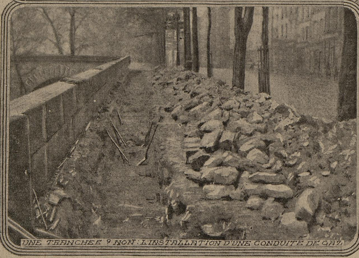
UNE TRANCHEE ? NON : L'INSTALLATION D'UNE CONDUITE DE GAZ