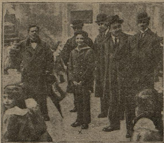
S. A. R. : prince Umberto, héritier du trône d'Italie, visitant les enfants des mobilisés recueillis à l'hôpital Saint-Michel, à Rome.