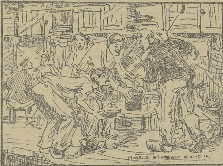
LES GROSSES RATIONS - DE FLINKE PORTIE

Une réputation et la gravure s'en fera chez un spécialiste des émissions de timbres postaux d'états. Collectionneurs et philatélistes ne peuvent donc pas manquer de les acquérir.