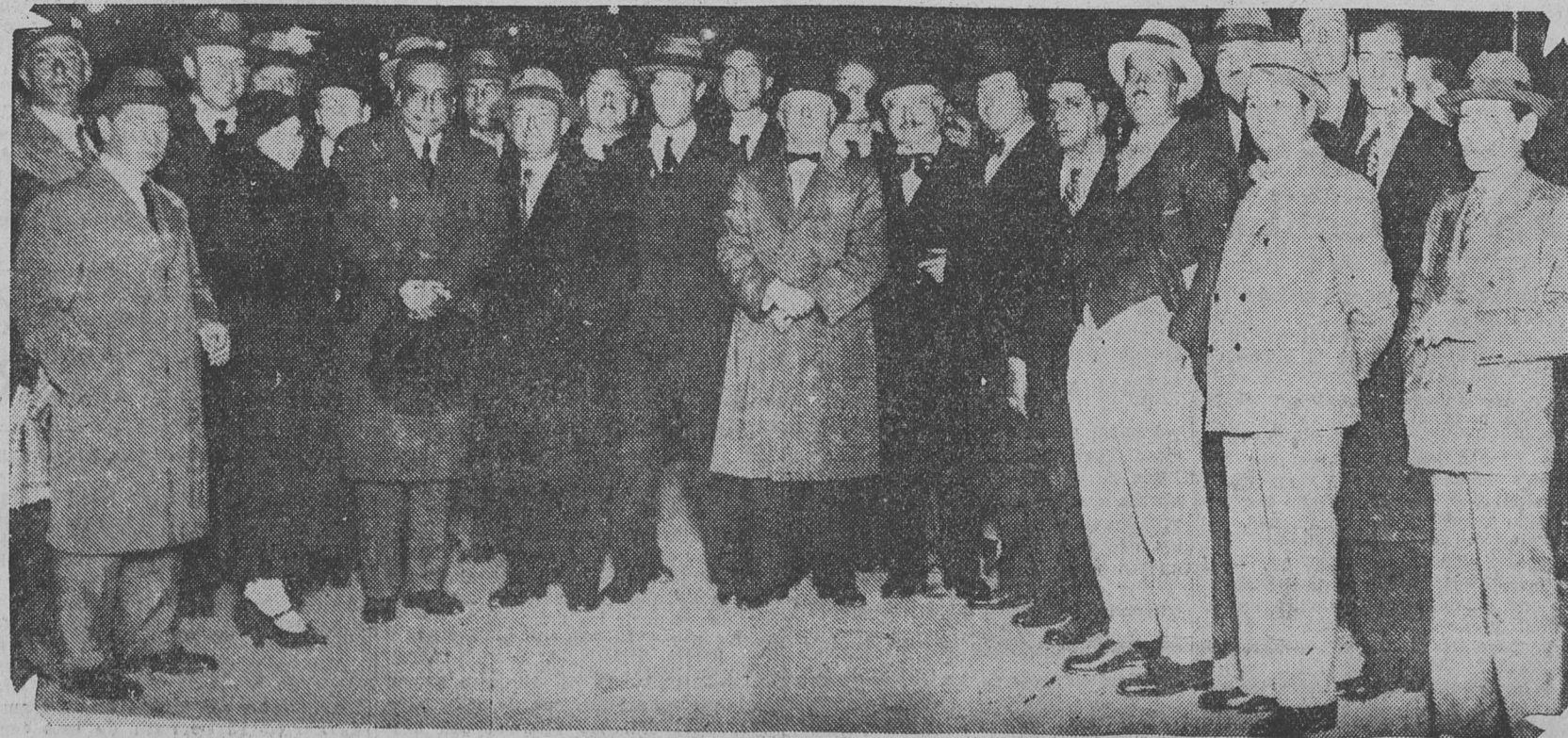
UN GRUPO DE DELEGADOS REUNIDOS EN EL ANDEN DEL F. C. C. A. MOMENTOS ANTES DE PARTIR PARA SANTA FE

NOTA — La lista precedente com- prende solamente los delegados cuya designación han hecho conocer los centros al Comité Ejecutivo.