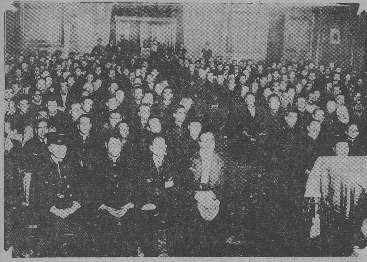
UNA VISTA DE LA CONCURRENCIA EN EL ACTO ORGANIZADO POR LA U. TRANVIARIOS

Terminó el acto, que se desarrolló dentro del mayor entusiasmo, con nutridos aplausos para los candidatos de la organización.