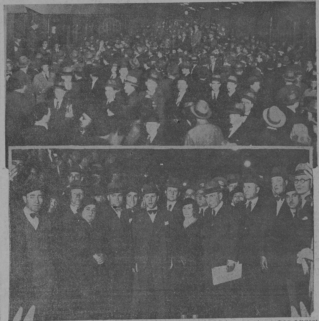
PARTE DE LA CONCURRENCIA QUE DESPIDIO EN LA ESTACION RETIRO A LOS LEGISLADORES SOCIALISTAS

Con motivo de la llegada de la delegación compuesta por los parlamentarios socialistas, se organizó una gran manifestación que acudió a la estación