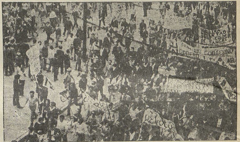
EL TERROR DE TODOS LOS PATRONES: Surgen nuevas direcciones clasistas.

El movimiento obrero fue utili- zado constantemente, ya sea en los procesos electorales como en los momentos de movilización, para poder llevar adelante esta concepción patronal. Y es así como hoy, después de más de quince años de derrotas, ha per- dido ese entusiasmo que despertaba el peronismo hace algunos años atrás. Pero esto no quiere decir que ya el peronismo no tiene nin- gún peso, todo lo contrario. Im- portantes sectores del conjunto de la clase obrera todavía siguen viendo en Perón a su dirigente, porque si bien perciben muchos de sus errores, no han agotado la