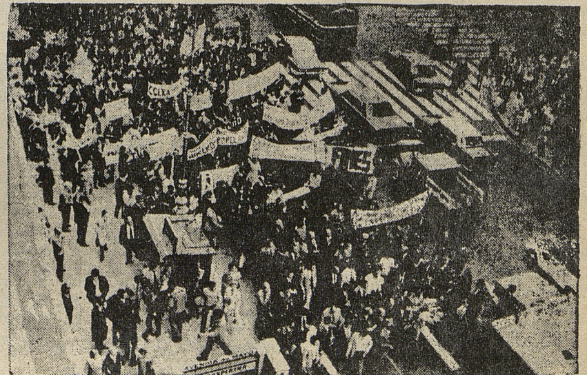
MANIFESTACION DE DOCENTES

Opuesta a la anterior, fue la posición que planteaba: "no se puede hacer nada hasta que no cambie la estructura socioeconómica del país". Esto tampoco arma a la docencia para encontrar soluciones. Los sectores que defendían este argumento utilizaron el Congreso para "concientizar" y hacer mera propaganda sobre la "soberanía popular", "el retorno de Perón" y el revisionismo histórico. Debemos dejar claro que entre los que sustentaron esta posición, hubo quienes intentaron dar una respuesta más concreta al temario en discusión.