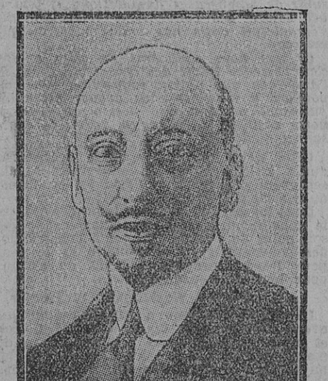
LE PORTE EST GRIÈVEMENT BLESSÉ

Rome, 26 Février. Gabriele d'Annunzio qui, a, on le sait, le grade de lieutenant dans l'armée italienne, vient d'être admis à l'hôpital militaire de Venise à la suite de blessures reçues au cours d'une chute en aéroplane. Les médecins espèrent pouvoir lui conserver la vue de l'œil droit.