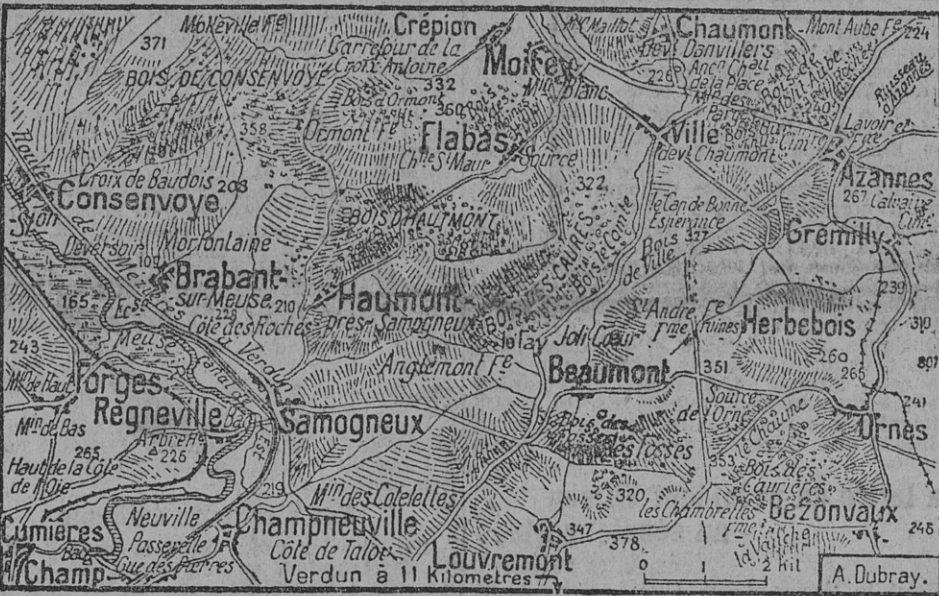
CARTE DES OPÉRATIONS DEVANT VERDUN

Le gouvernement fait, à 15 heures, le communiqué officiel suivant : La lutte est toujours âpre dans la région au nord de Verdun, où l'ennemi continue à porter ses efforts sur le front à l'est de la Meuse. D'après les derniers renseignements, nos troupes résistent sur les