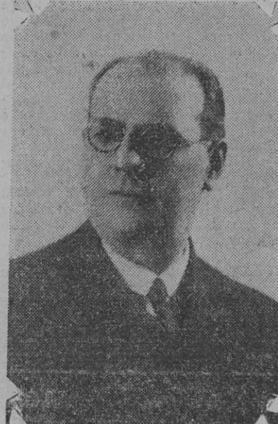
Diputado DEMETRIO BUIRA