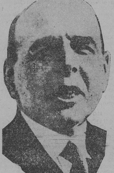
Diputado NICOLAS REPETTO