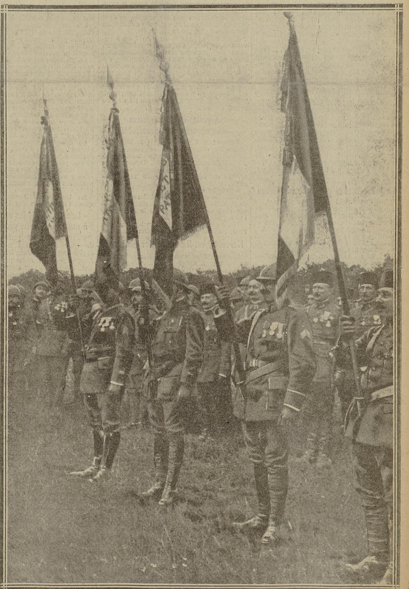
LES 4 DRAPEAUX DE LA DIVISION MAROCAINE QUI REPRESENTENT 16 CITATIONS

qui a quatre citations, et, avec la fourragère verte et rouge, le 4 e et le 7 e tirailleurs, qui en ont trois, puis l'artillerie de la division, qui est titulaire de deux citations. Il faut 2 citations pour la fourragère verte et rouge ; 4 pour la jaune ; 6 pour la rouge.