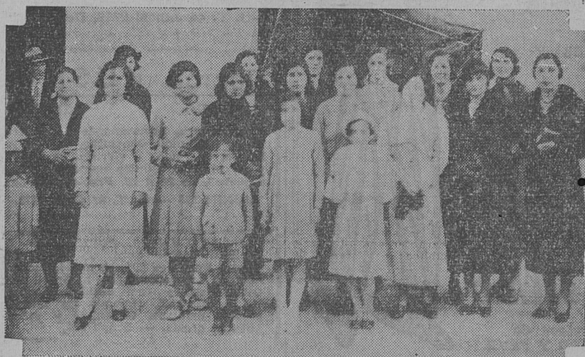
PARANÁ, 28. — Convocada por la comisión administrativa del Centro Socialista de la zona norte (Paraná), se reunió una entusiasta asamblea de mujeres para dejar consti-

tuido el Centro Femenino, que luchará en esta ciudad por los ideales del socialismo.