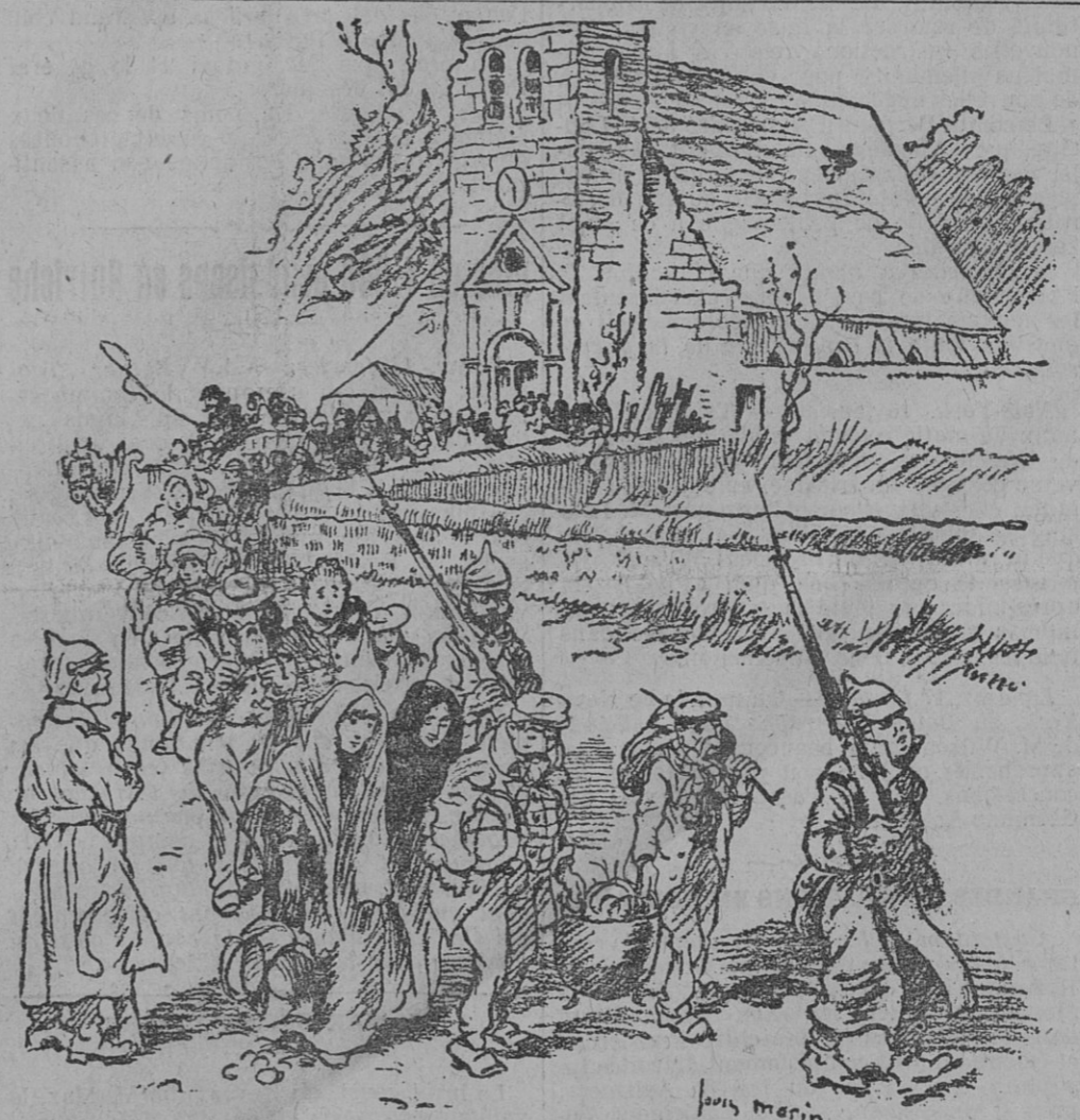
LE DÉPART DE L'ÉGLISE DE NAMPCEL ...J'avais des sabots aux pieds ; sur le dos un bâton au bout d'un bâton.

Il y a quatre lieues de Nampcel à Chauny. Pour la première fois nous