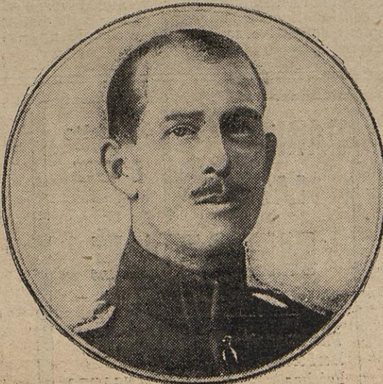
PRINCE ANDRÉ DE GRÈCE

Il est presque impossible que le gouvernement traite une question quelconque relative aux relations étrangères, parce que les hommes d'Etat savent partout que pour le moment aucune solution internationale ne peut être définitive.