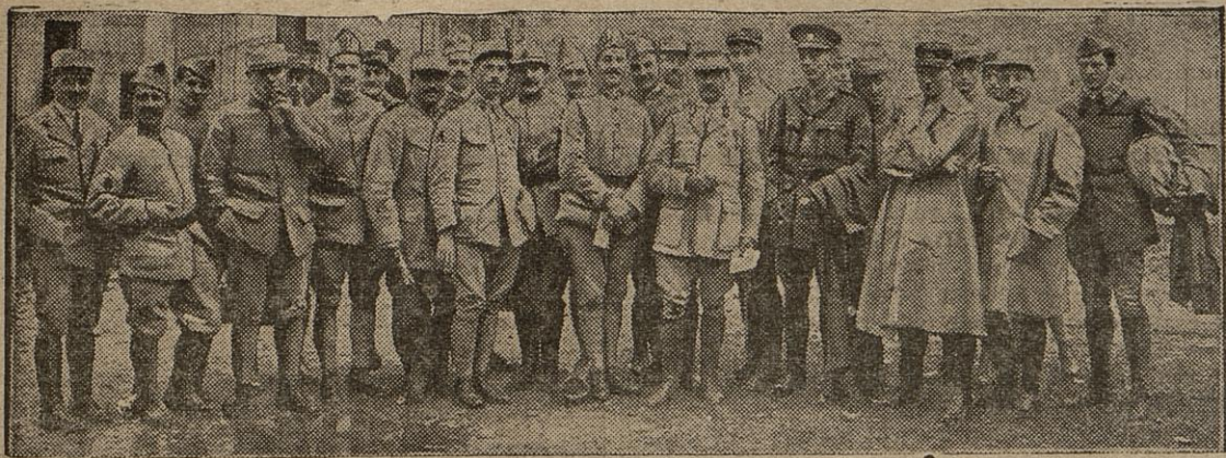
LA DELEGATION DU 20 e CORPS