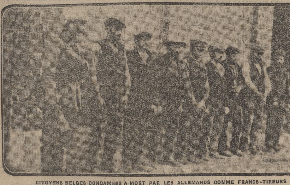
CITOYENS BELGES CONDAMNÉS À MORT PAR LES ALLEMANDS COMME FRANCS-TIREURS