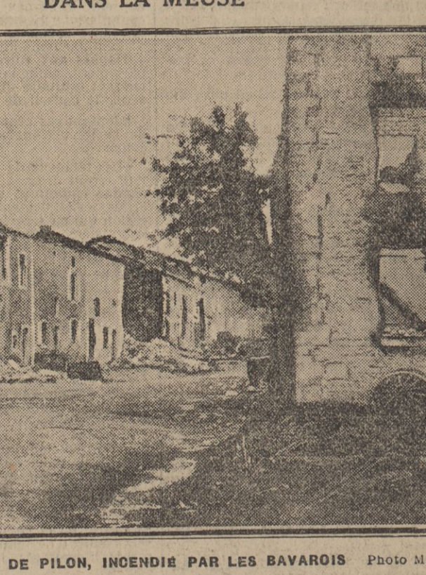
LE VILLAGE DE PILON, INCENDIÉ PAR LES BAVAROIS

TROMPE-LA-MORT PAR JULES MARY. Dernière Année; Dernier Espoir.