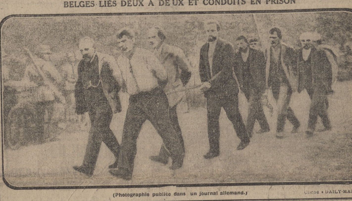
(Photographie publiée dans un journal allemand.)

« Parmi les constatations qui ont le plus surpris — et aussi choqué parfois — le public et les médecins eux-mêmes, c'est la façon, en apparence incohérente, avec laquelle on a utilisé le personnel médical pour les soins à donner aux blessés.