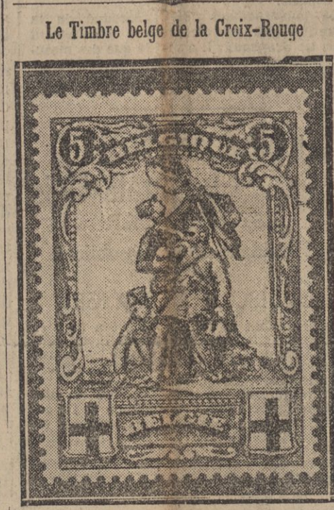
Le Timbre belge de la Croix-Rouge

« La retraite s'impose... L'armée allemande, commandée par von Kluck, se précipita par cette route.