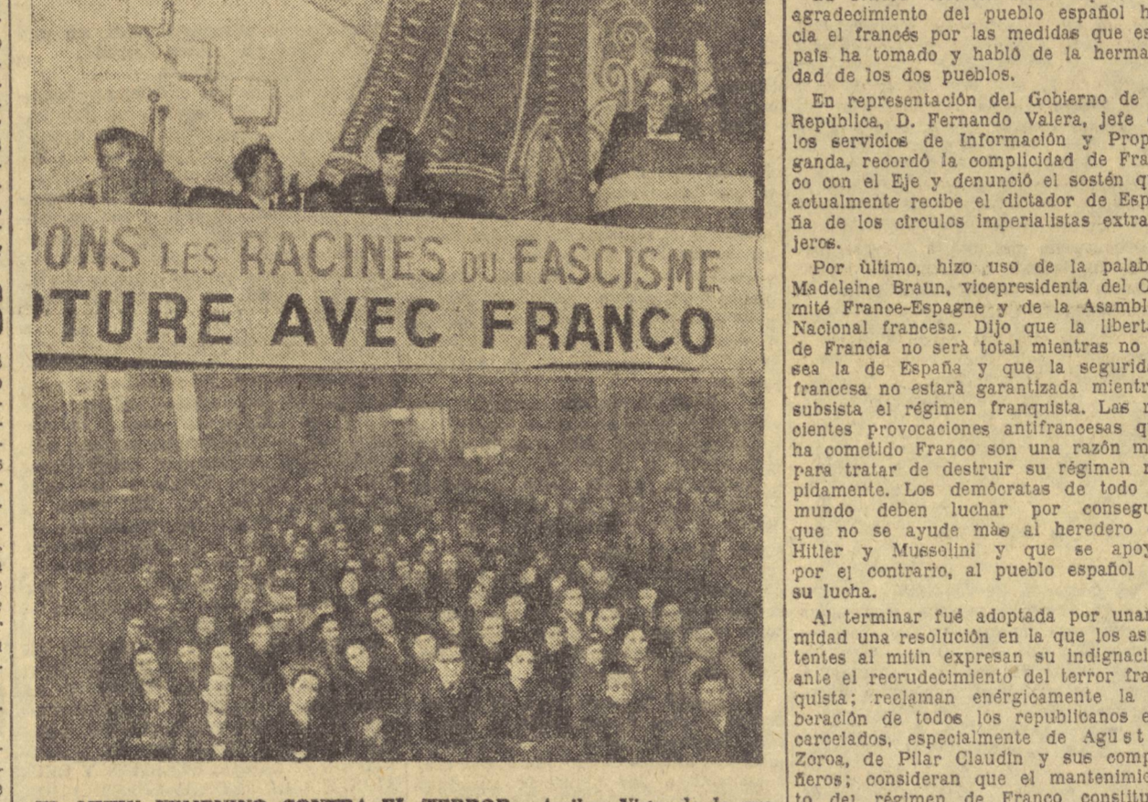
EL MITIN FEMENINO CONTRA EL TERROR.—Arriba: Vista de la presidencia. Abajo: Un aspecto de la sala.