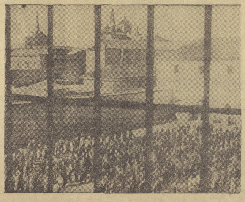
ESPAÑA ENTRE REJAS.—El patio de una de las cárceles franquistas.

En Ciudad Real, como en toda España, las detenciones y torturas de patriotas españoles han alcanzado en estos últimos tiempos límites insospechados. En la denuncia y persecución de los patriotas españoles de esa provincia se ha distinguido por el jefe local de Falange del pueblo de Sanchilamón. Pero esta bandido falangista ha pagado sus crímenes. El domingo 15 de diciembre un grupo de guerrilleros llegó a Sanchilamón y se presentó en su casa. Inmediatamente se constituyeron en tribunal para juzgar a este criminal falangista. En el juicio le condenaron a muerte y la sentencia fue inmediatamente ejecutada. La población, que odiaba al jefe local de Falange, aplaudió a los guerrilleros por la acción justiciera, que acababan de realizar, después de la cual éstos se retiraron a sus bases.