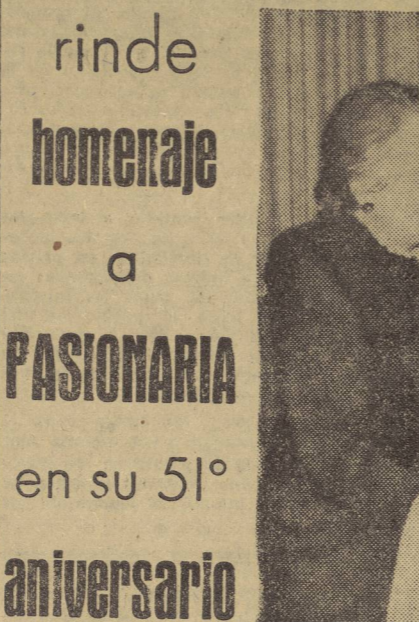
Dolores Ibaruri conversando con el presidente del Partido Comunista checoslovaco y jefe del Gobierno de su país, camarada Klement Gottwald.

En Karlovy Vary (Ceska Budejovice), donde nuestra camarada Pasionaria está siguiendo una cura, ha recibido el homenaje y el cariño del pueblo de Checoslovaquia el día de su cumpleaños.