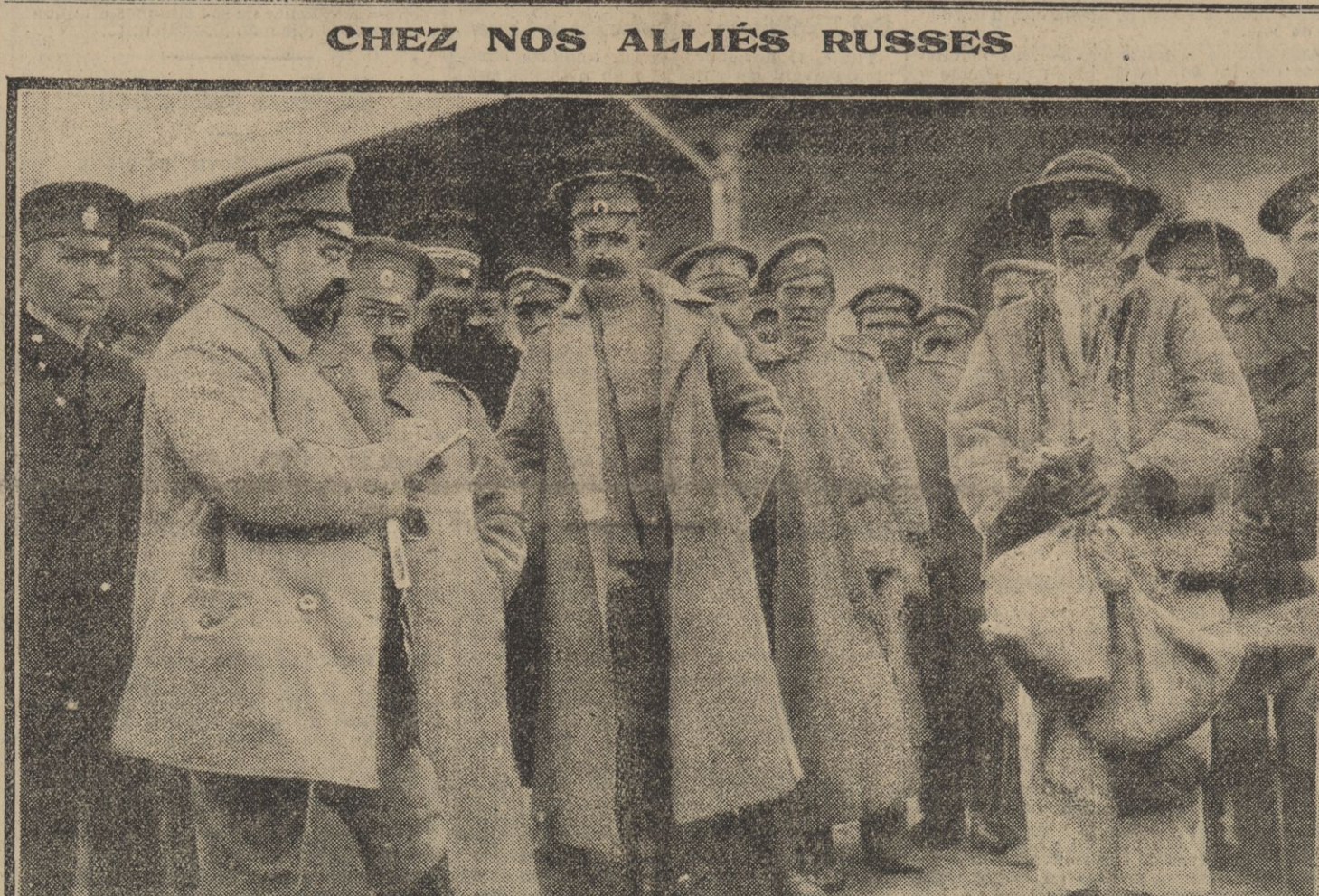
Un célèbre artiste russe, actuellement officier dans l'armée du tsar, dessine les traits d'un espion allemand que l'on voit à droite de la photographie.