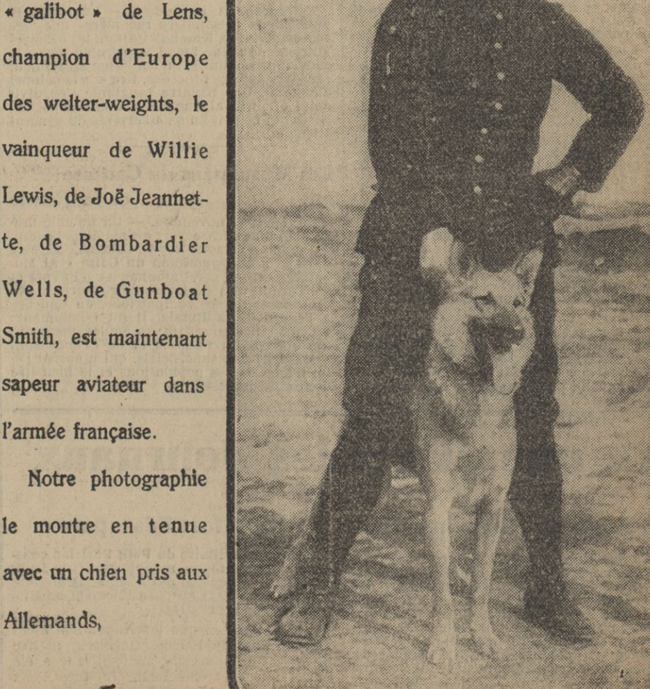
Le boxeur CARPENTIER