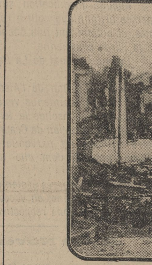
LES RUINES DE SERMAIZE-SUR-MARNE