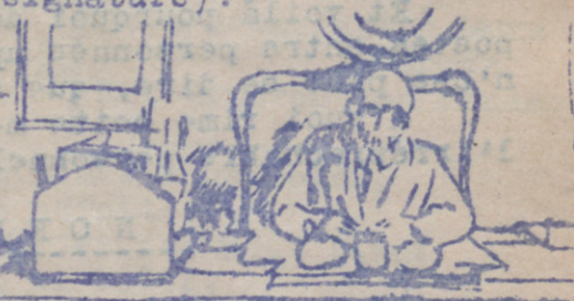
Mr. Clemenceau, Président du Conseil, Ministre de la Guerre