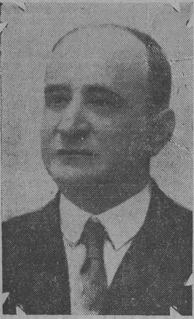
Diputado electo a la legislatura bonaerense, por la primera sección electoral