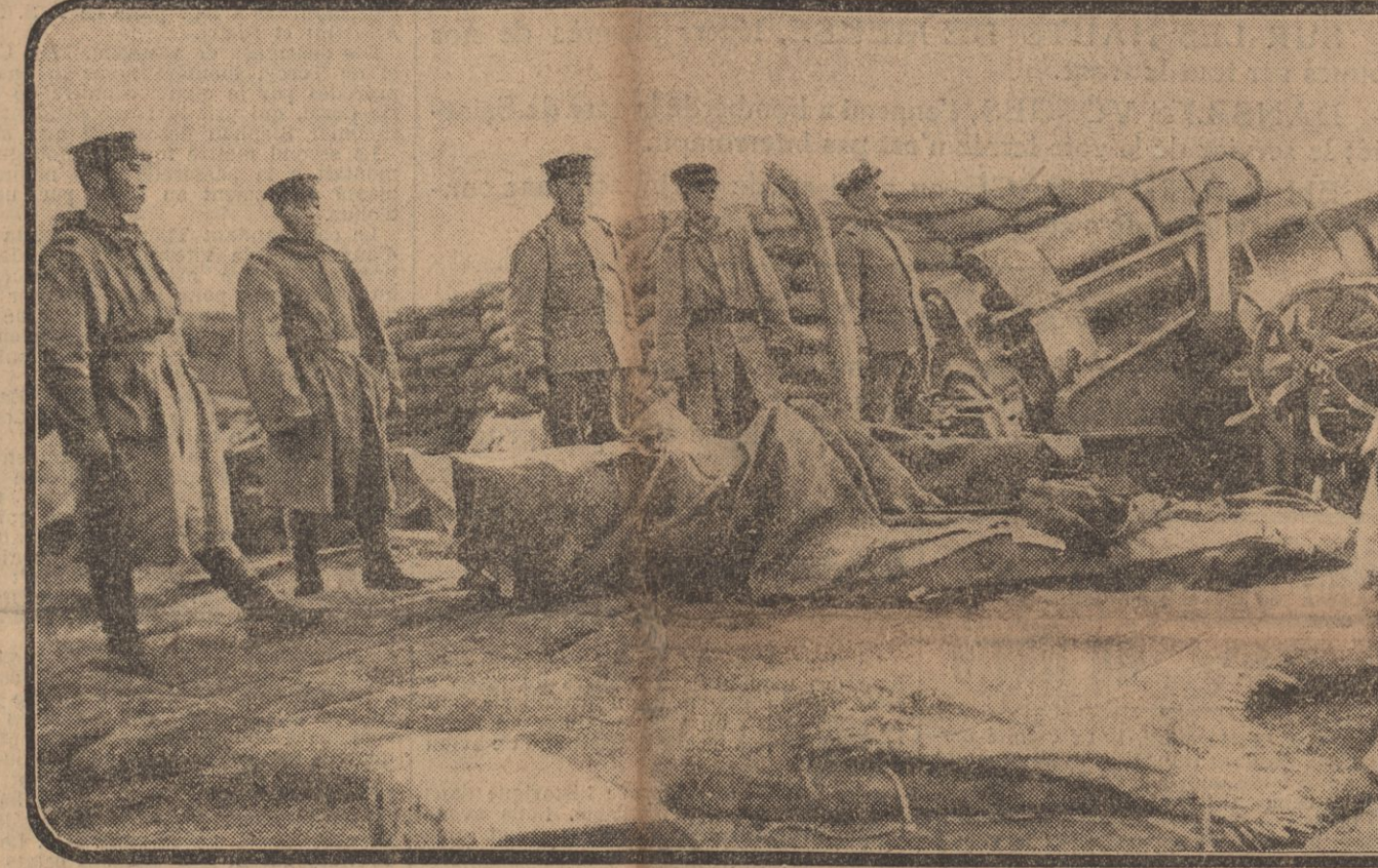
Une de ses pièces lourdes japonaises qui ont bombardé la place