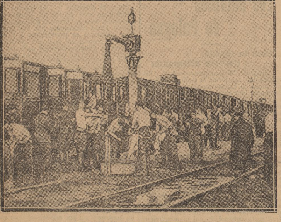
LES ANGLAIS FONT LEUR TOILETTE