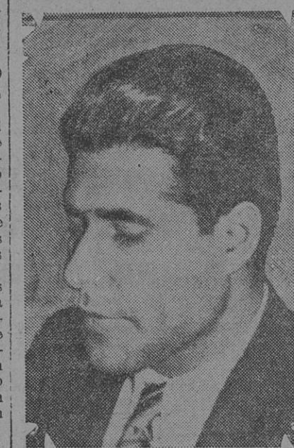
Diputado provincial que pidió a dos agentes del escuadrón detuvieran a su agresor sin ser atendido

del escuadrón de seguridad que me llevaron hasta la comisaría 10a. Durante el trayecto siguieron golpeándome y arrastrándome. Al llegar a la comisaría 10a. me entregaron al centinela diciéndole: "Aquí tenés a éste".