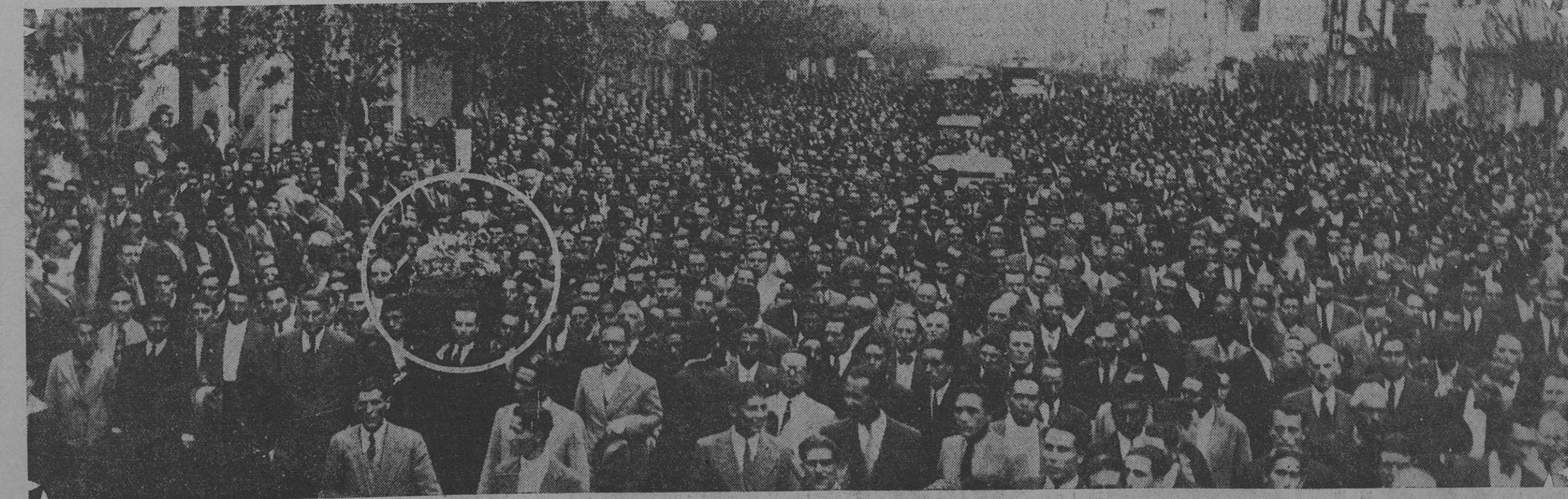
UNA PARTE DE LA ENORME MUCHEDUMBRE QUE ACOMPAÑÓ LOS RESTOS DEL COMPAÑERO GUEVARA HASTA EL CEMENTERIO LOCAL, AL PASAR POR LA AVENIDA OLMOS donde al paso del féretro fueron arrojados desde muchos balcones ramilletes de flores. — EN CIRCULO: El féretro.