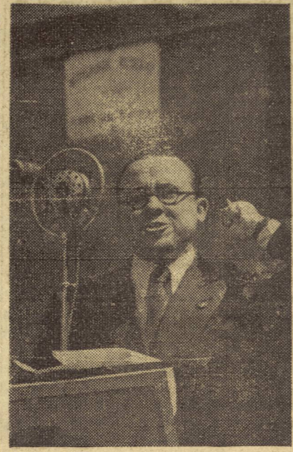
EL CAMARADA SANTIAGO CARRILLO DURANTE EL DISCURSO QUE PRONUNCIÓ EN EL ACTO HOMENAJE A CRISTINO EN SAINT-DENIS EL PASADO DOMINGO

¡Alerta, españoles, todos a una para destruir los planes de capitulación ante el enemigo!