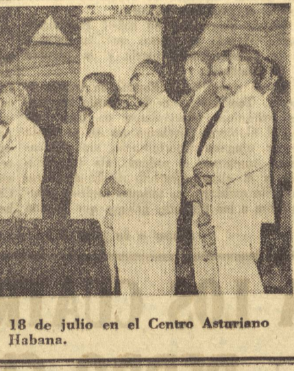
Presidencia del acto celebrado el 18 de julio en el Centro Asturiano de La Habana.