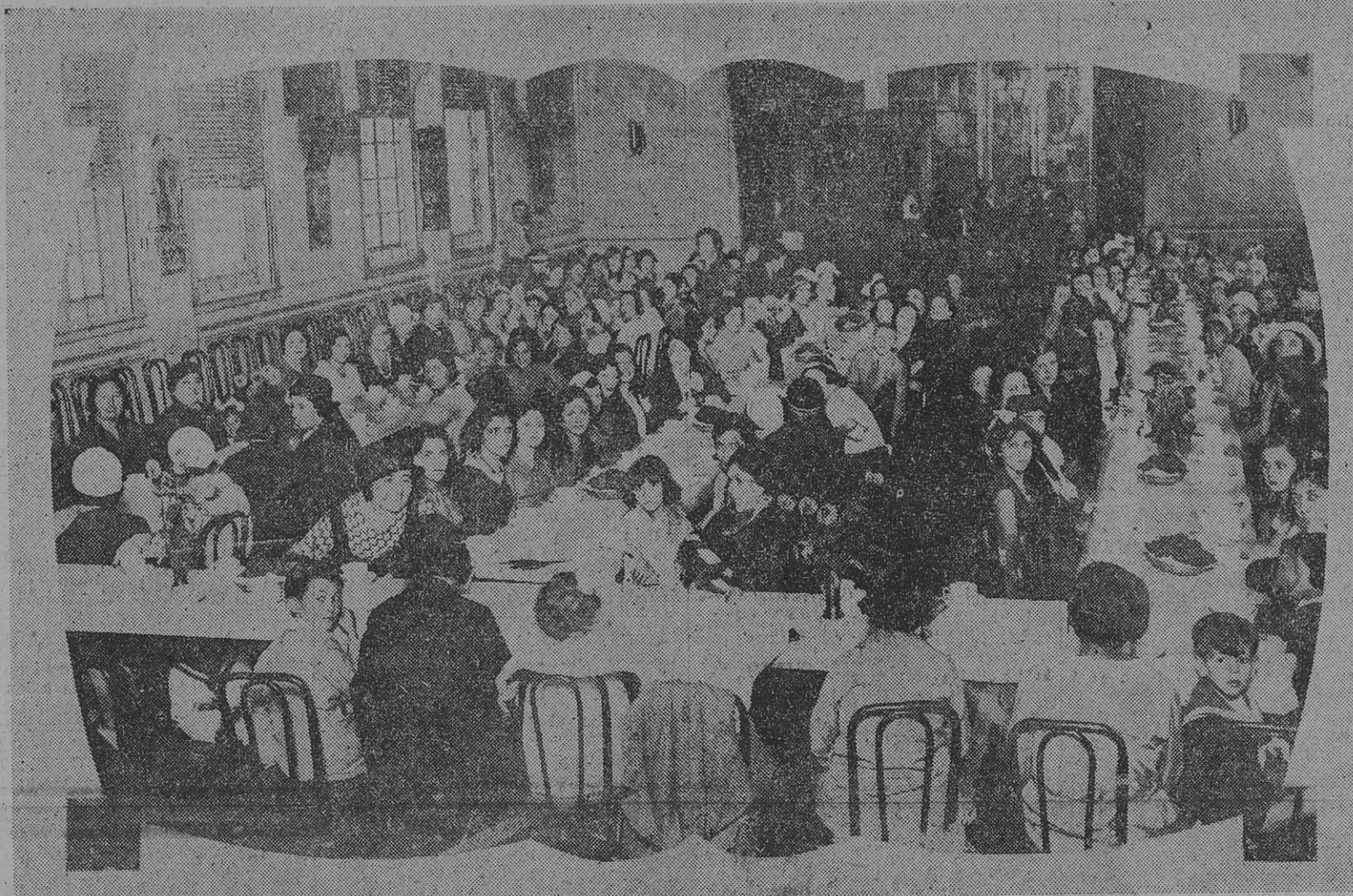
LA NUMEROSA CONCURRENCIA EN LA BRILLANTE REUNION DE AYER

Al retirarse del local de la sucursal central de "El Hogar Obrero", muchas fueron las compañeras que