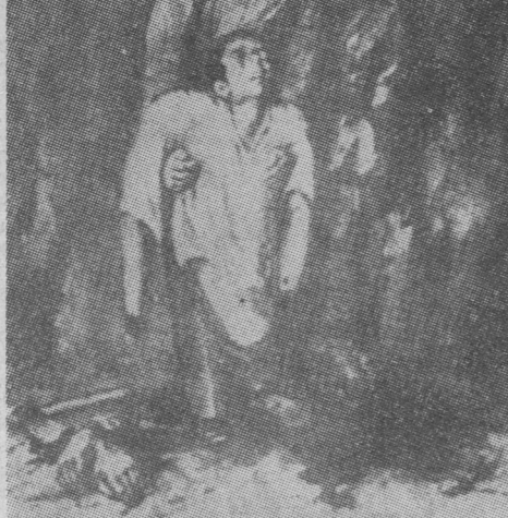
Dibujo de Castella.

¡ Para que levantes los puños... ! El crimen de cortar manos, brazos y senos se puso a la orden del día con el franquismo. Y eso fué lo más suave. Porque matar personas fué la norma permanente, como si el asesinato fuese un deporte... Los campos españoles están sembrados de barbaridades. La sangre los ha regado hasta lo profundo. Todo ya es rojo escarlata en las tierras españolas. Y es tanto el horror al crimen, que hasta las piedras han de rebelarse contra los autores de tanta maldad. Imperios más grandes han caído... También caerá este imperio del terror, del asesinato, de las violaciones, del secuestro y atropello a las personas. España no ha muerto. El pueblo español vive y alerta. Día llegará en que los españoles saldrán por los fueros de su dignidad y recuperarán las libertades perdidas. Nadie puede desanimarnos, pues estamos curtidors por cien mil adversidades. Estamos seguros del triunfo final de nuestra causa. ¡ Arriba los corazones !