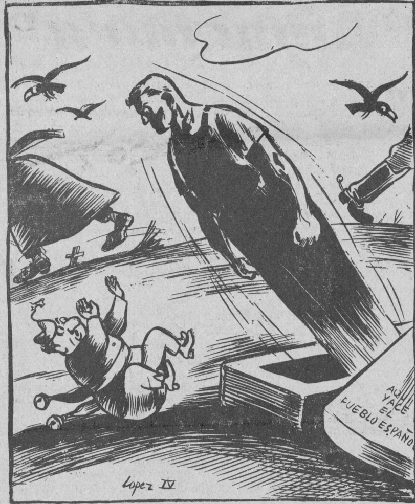
Para la hora del balance, hasta los muertos se levantarán justicieros de sus tumbas.