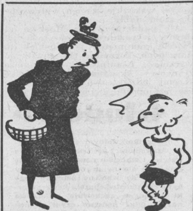
rys. A. HOROWICZ

— Czy Twój ojciec wie, że palisz papierosy? — A czy Pani mąż wie, że zaczepia Pani obcych mężczyzn na ulicy?