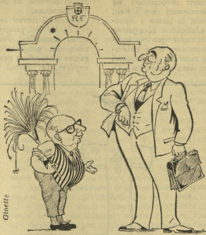
« MERCI, MON AMI, MERCI »

C'est une vaste foire dont tout le monde reconnaît les méfaits, découvrant peu à peu des changements et dont tout le monde subit passivement les érosions. Cette abdication de l'homme se développe lentement, progressivement, l'état se resserre, arrive à un certain degré on ne pourra plus rien et nous se-