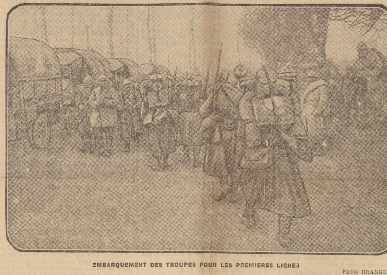
EMBARQUEMENT DES TROUPES POUR LES PREMIERES LIGNES.