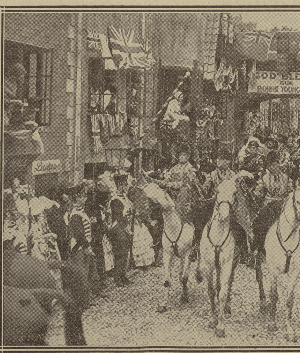
LE COURONNEMENT DE LA REINE VICTORIA, AU CINEMA

Rien n'arrête plus l'audace des entrepreneurs de films, qui ont certainement résolu de satisfaire les sourires de la Fortune. C'est ainsi que l'on « tourne » maintenant, en Angleterre — à Isworth, pour être exact — de merveilleuses reconstitutions des faits les plus pittoresques de l'histoire d'Angleterre.