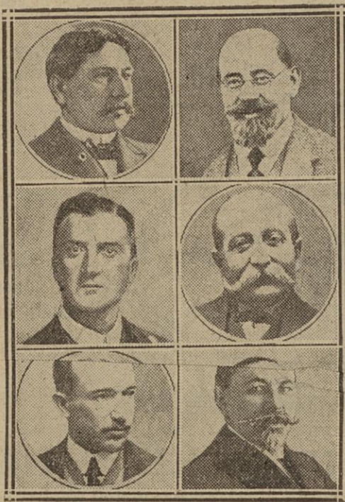
MM. VON KAHR ET RENNER, L'AMIRAL HORTHY, MM. TAKE JONESCO, BENÈS, ET VESNITCH.

Elle se complique d'autant plus qu'à ce moment l'Italie entre en scène. Est-ce qu'il ne se forme pas, dans l'Europe centrale, avec extension vers l'Europe orientale et la Méditerranée, un bloc qui ressemblerait beaucoup à l'ex-empire austro-