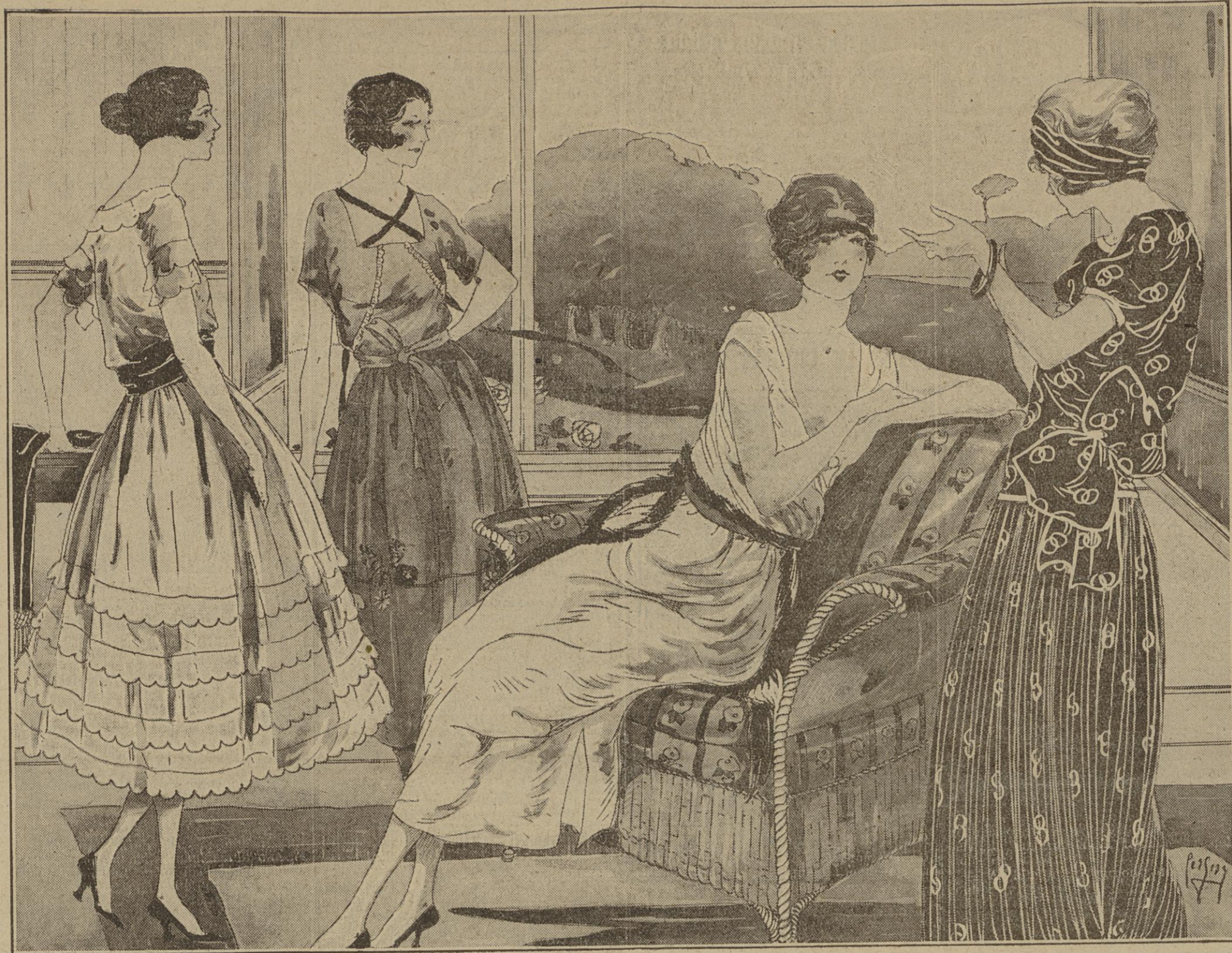
Robe de pongé bien à volants découpés. Ceinture de ruban. — LANVIN.