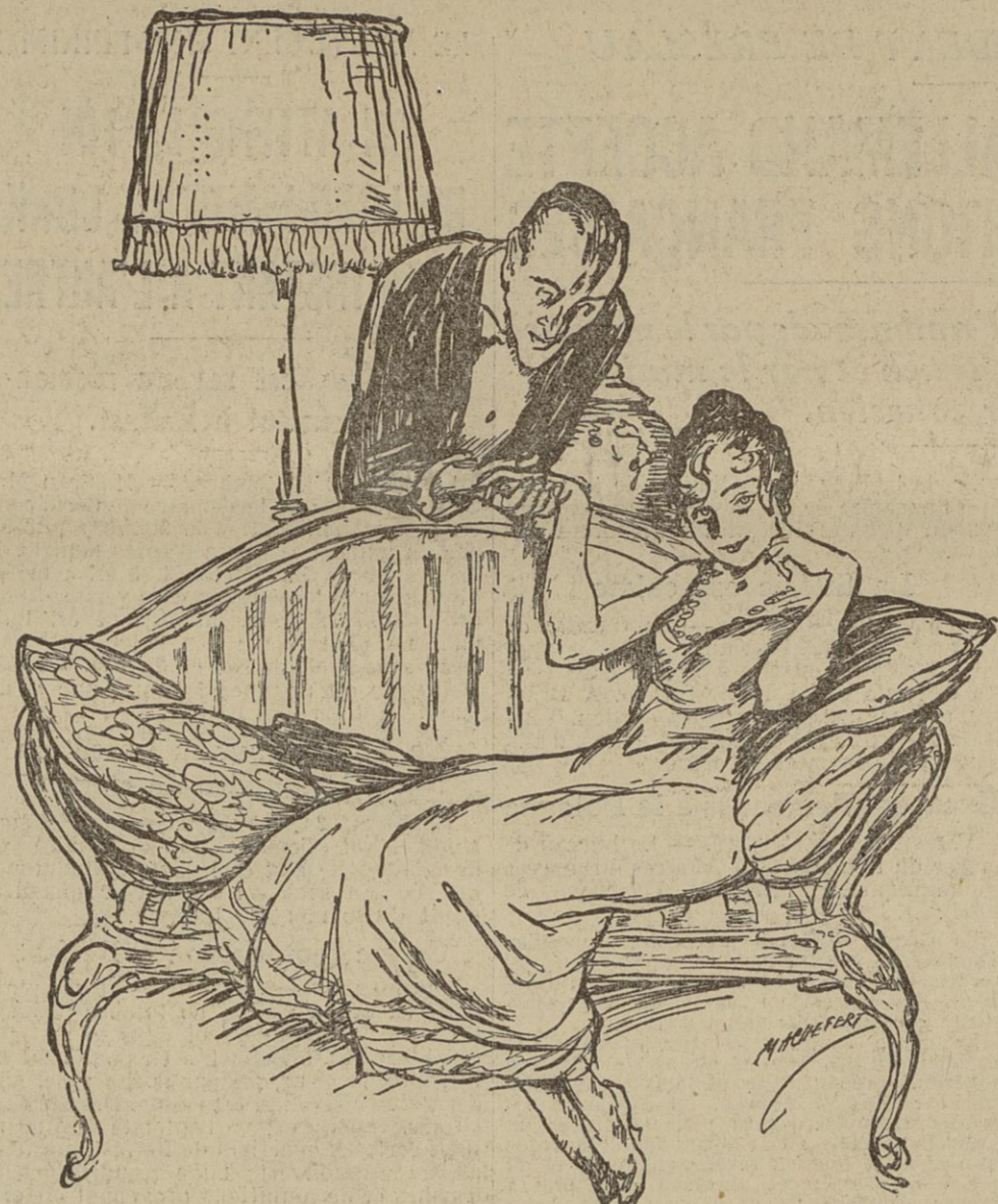
— Je voudrais bien savoir s'il va me demander ma main ou seulement ma voix...