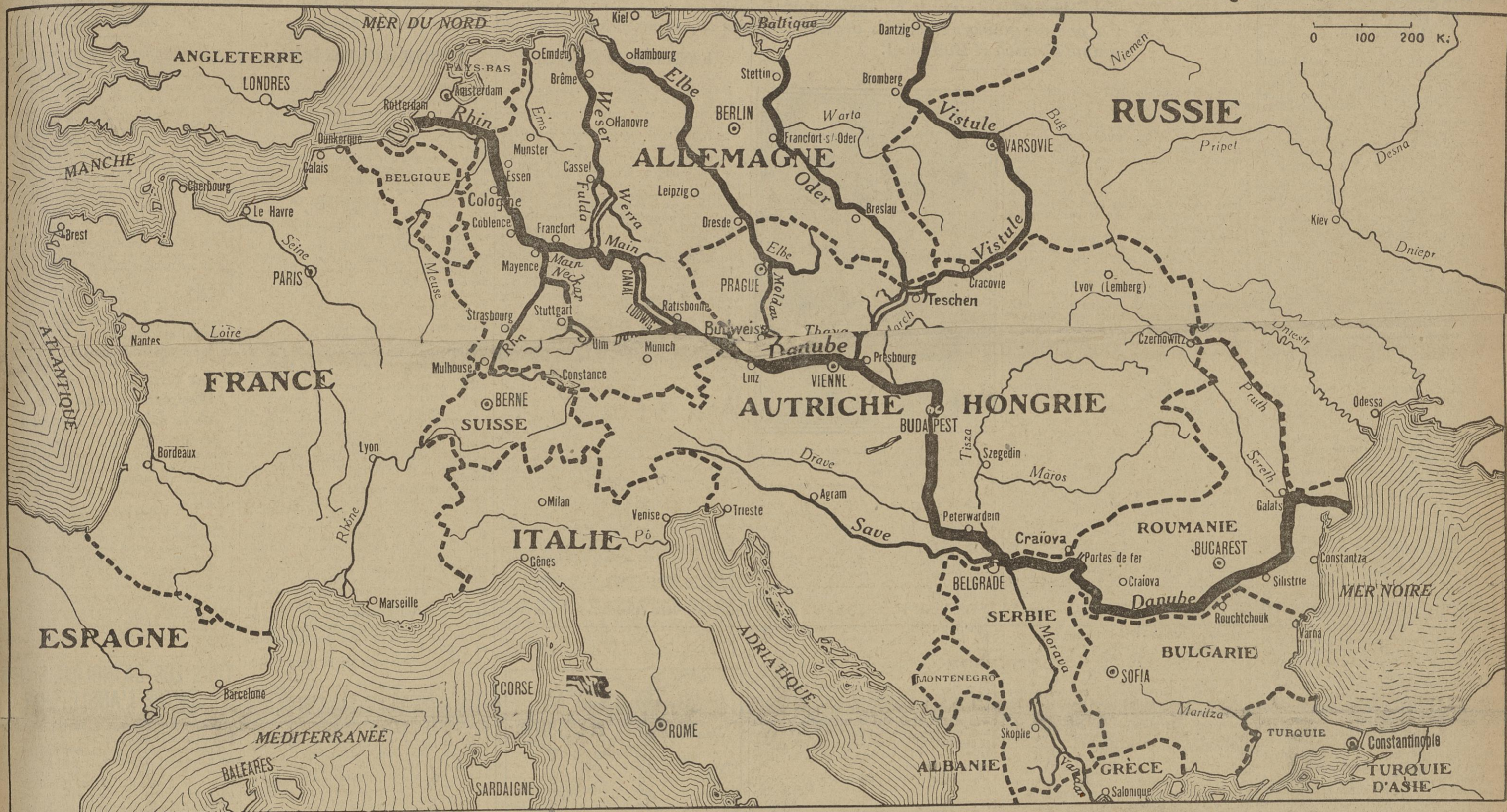
AVANT LA GUERRE, L'ALLEMAGNE AVAIT CONÇU UN SYSTÈME DE CANAUX QUI DEVAIT RELIER TOUS SES FLEUVES AU DANUBE

AYANT RETROUVÉ SA RIVE DU RHIN, LA FRANCE DOIT ASSURER SON EXPANSION ÉCONOMIQUE VERS L'ORIENT