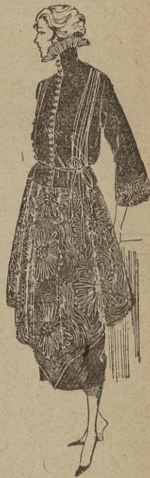
MODÈLE FRANCIS Robe de serge marine brodée blanc.