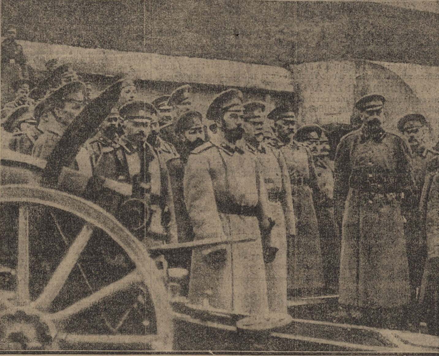
LE SOUVERAIN RUSSE AU MILIEU DE SON ETAT-MAJOR DANS LA FORTERESSE D'VANGOROD