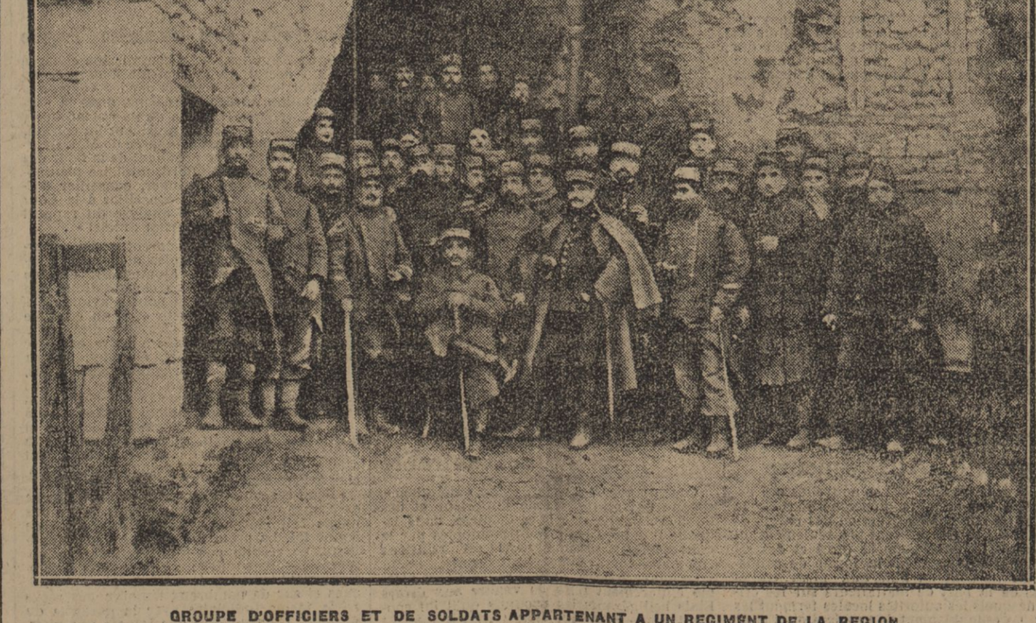
GRUPE D'OFFICIERS ET DE SOLDATS APPARTENANT A UN REGIMENT DE LA REGION