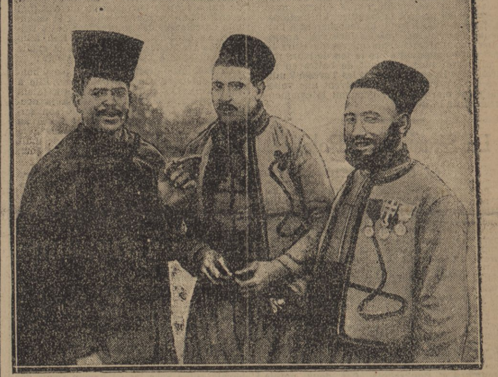
SOLDATS INDIGENES EN CONVALESCENCE A BORDEAUX

Allemands des pertes considérables. La situation militaire est complètement favorable à nos armes.