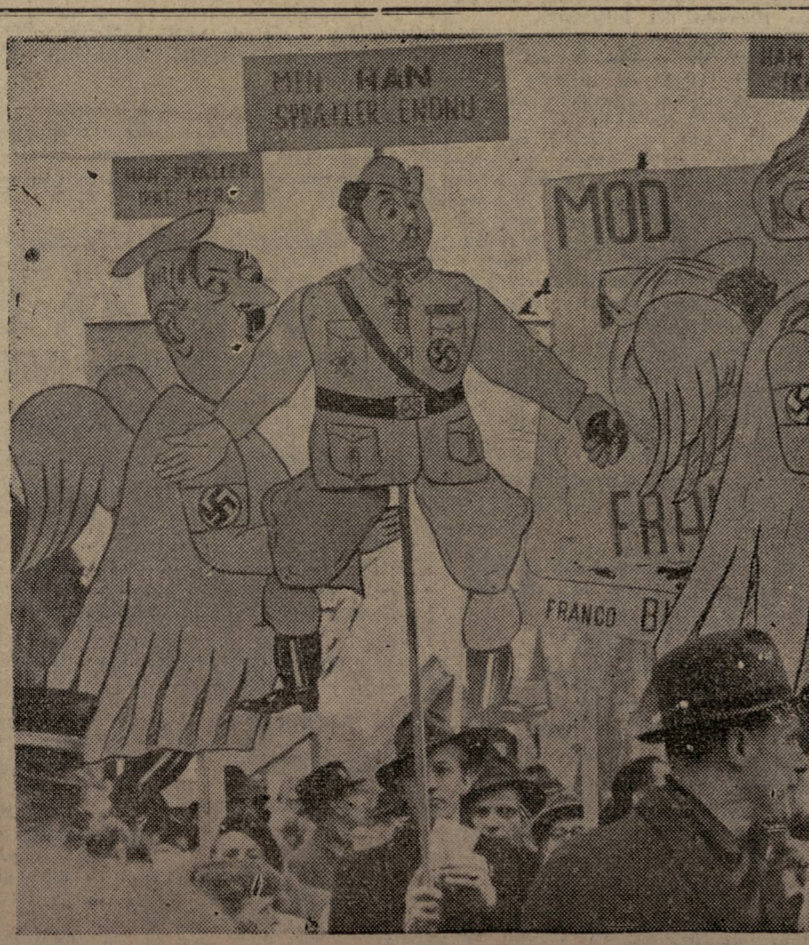
En la manifestación que se celebró en Copenhague con motivo de la conmemoración del 14 de Abril, y a la cual asistieron unas 150.000 personas, los manifestantes pasearon por las calles de la ciudad certeras caricaturas alusivas a la comunidad de destinos del asesino Franco con Hitler y Goebbels.