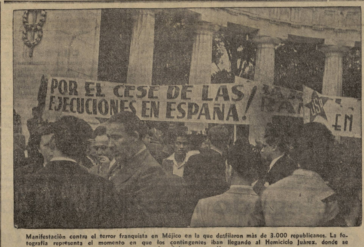
Manifestación contra el terror franquista en Méjico en la que desfilaron más de 3.000 republicanos. La fotografía representa el momento en que los contingentes iban llegando al Hemiciclo Juárez, donde se efectuó la concentración.