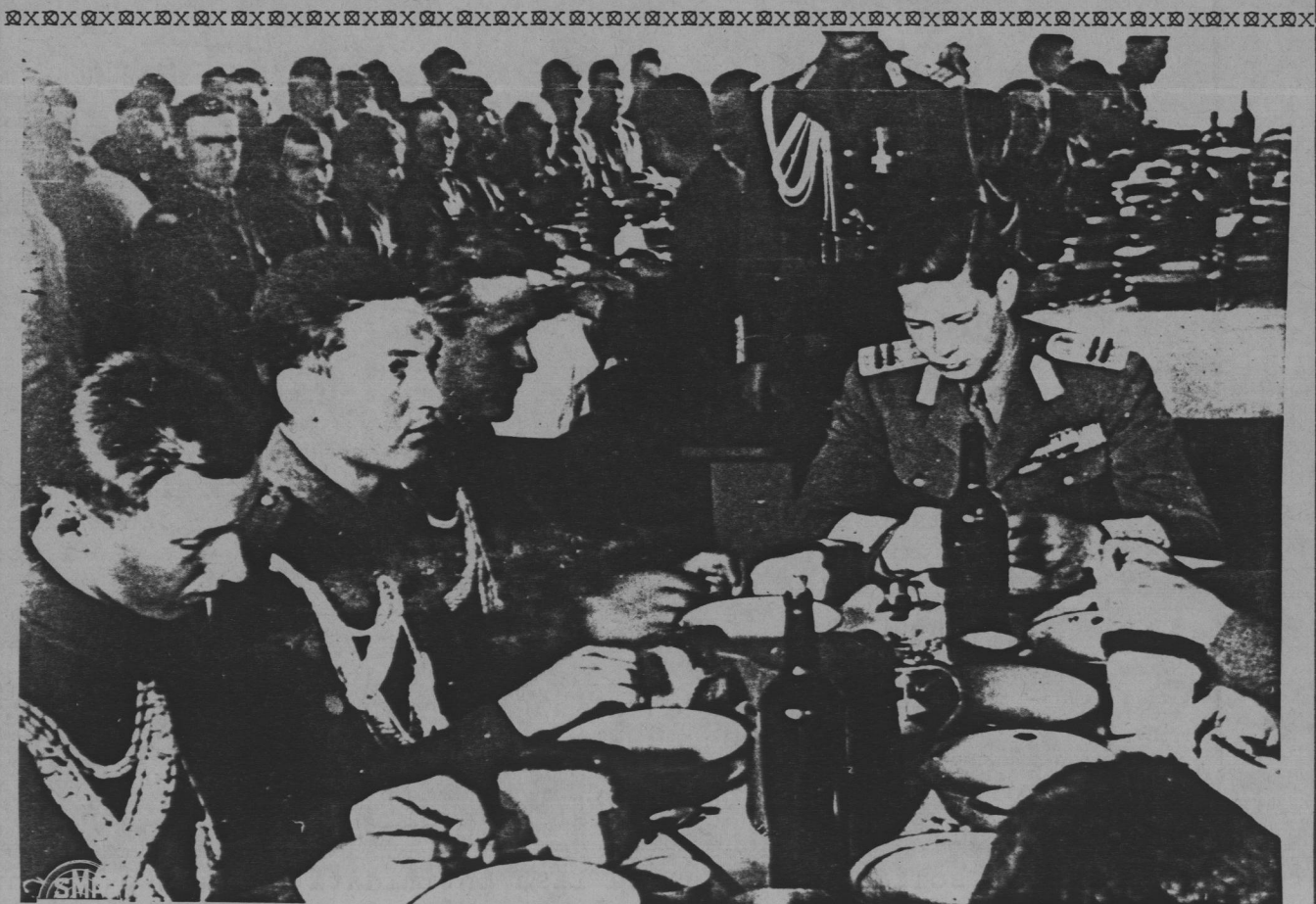
S.M. Le Roi MIHAI I-er, Chef de la Force Armée du Royaume de Roumanie, Etat National Unitaire et Indivisible, prend le repas avec ses soldats bien-aimés qui, avec bravoure, pendant les années 1939-1945, ont défendu l'Indépendance Souveraine et l'Intégrité territoriale du Pays et ont puni, tour à tour, chacun des envahisseurs ennemis.