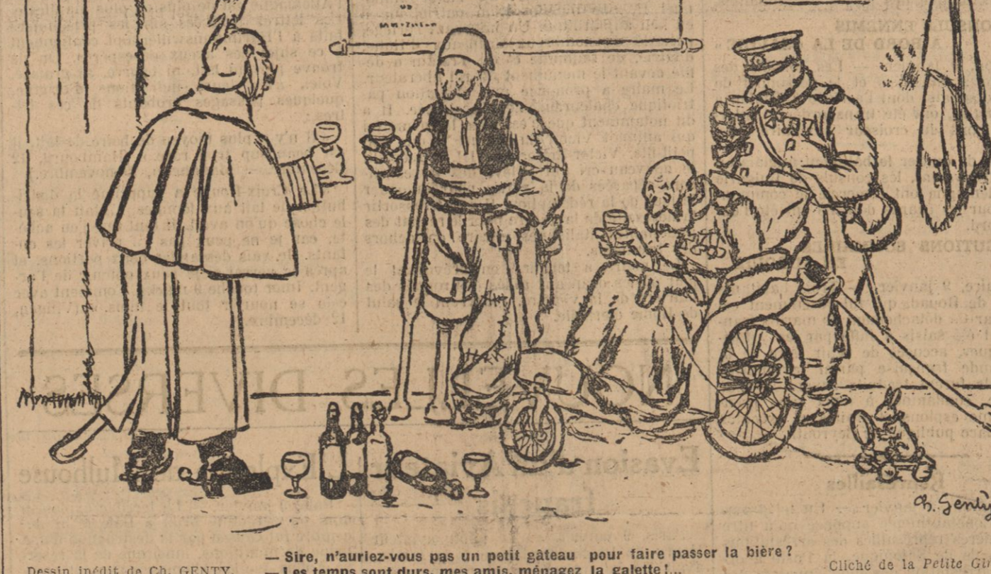
— Sire, n'auriez-vous pas un petit gâteau pour faire passer la bière ? — Les temps sont durs, mes amis, ménagez la gallette !