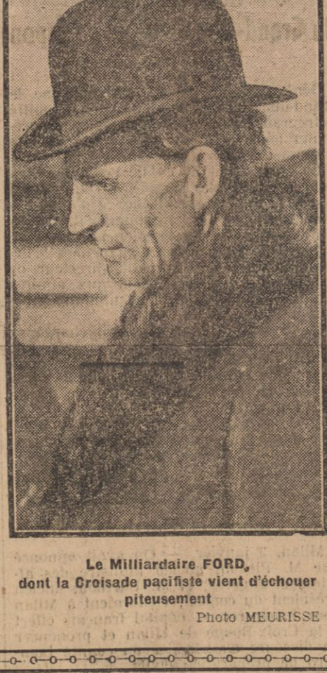
Le Millionnaire FORD, dont la Croisade postiche vient d'échouer pleinement

« J'ai été vivement charmé de recevoir votre carte et vous remercie beaucoup pour tous les bons souhaits que vous m'exprimez et que j'apprécie grandement... »