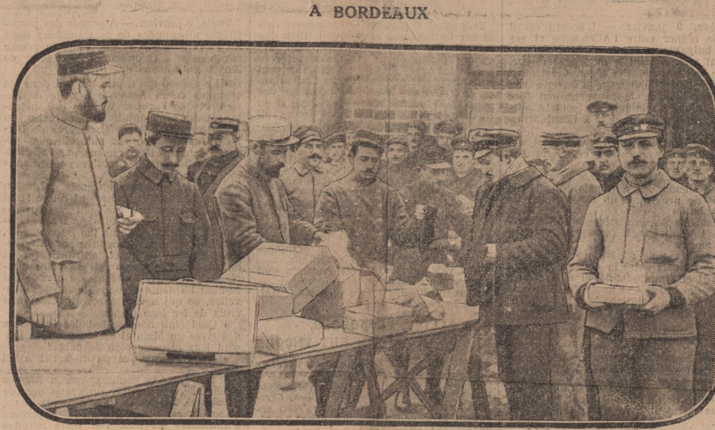
DISTRIBUTION DES COLIS AUX PRISONNIERS ALLEMANDS

« Oh ! oui, Monsieur, c'est mon défaut. »